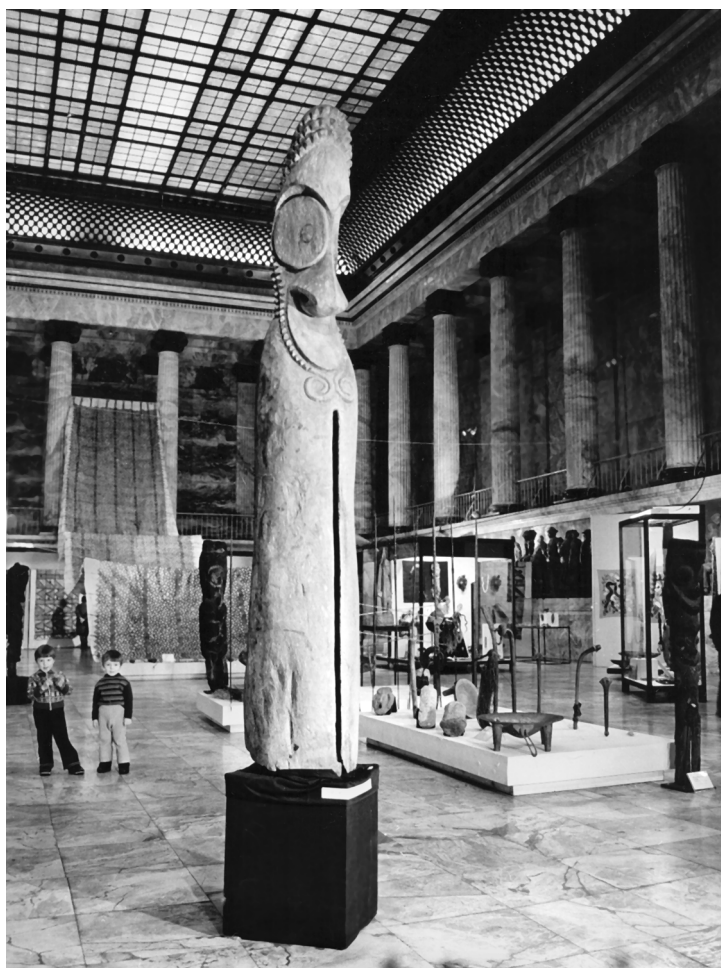
Общий вид выставки “Этнография и искусство Океании” в Мраморном зале Государственного музея народов СССР (ныне – РЭМ). Зима 1980/81 г.