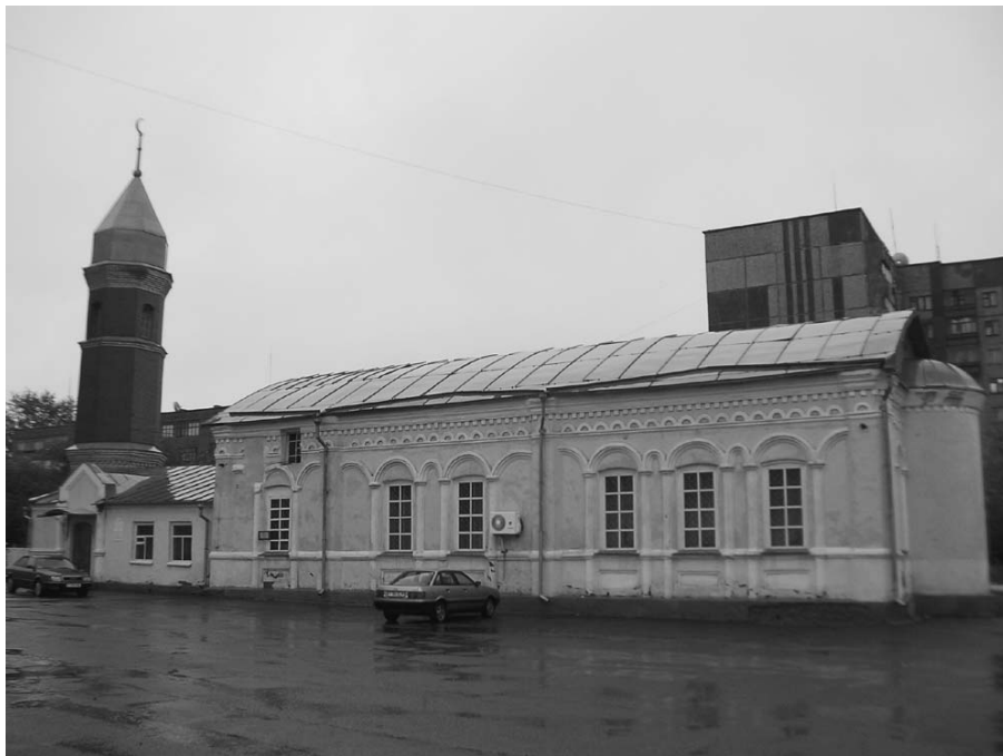
Янгуразовская мечеть № 6 постройки 1882 г.

ния, доля которого достигла в 1989 г. 22,5%, увеличившись относительно 1970 г. на 4,5% (Там же).