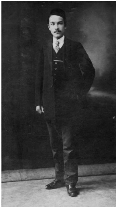
Татарский предприниматель начала XX в.