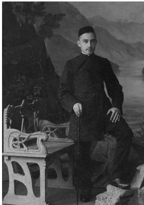
Татарский купец начала XX в.

центре города, одна – на меновом дворе, где в то время торговало большое количество купцов-мусульман.