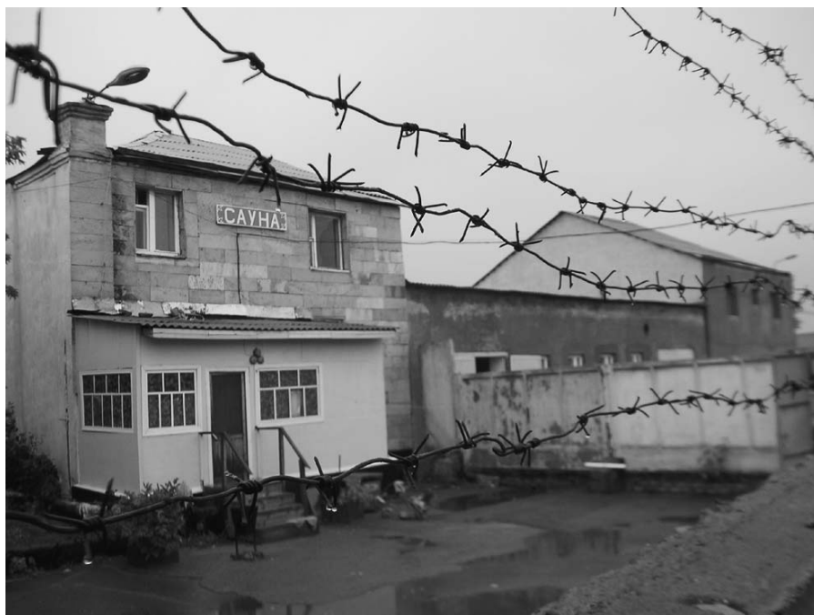
Так сегодня выглядит мечеть 1795 г.

Материалы глубинных интервью демонстрируют, что для татарского населения характерен ярко выраженный этноаффилиативный комплекс. Из интервью: "Я не знаю, к сожалению, татарского языка, песен, обычаев, но я всегда горжусь тем, что я татарка" (женщина, татарка, 1977 г. р.). "То, что я – татарин, я впитал с молоком матери. С возрастом отношение к своему народу у меня все более теплее. Иногда мне хочется окунуться в тот мир детства, где на улице и дома слышалась татарская речь. Это, по-моему, называется ностальгией" (мужчина, татарин, 1952 г. р.). "Когда я задумаюсь о том, кто я, то первое, что мне приходит на ум, – это то, что я – татарка. Так уж нам вложили с детства. Всегда была горда этим и чувствовала потребность быть частью своего народа" (женщина, татарка, 1933 г. р.). "Мы всегда жили дружно, никогда никого не разделяли по национальностям, но жениться надо было только на татарке. Думаю, что это правильно" (мужчина, татарин, 1928 г. р.).