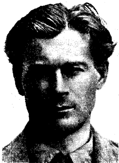
Рис. 2а. Светлый европеоидный тип (кряшен Чистопольского района)

Среди всех исследованных татар преобладает понтийский тип (33,5%), затем светлый европеоидный (27,5%), в меньшем числе