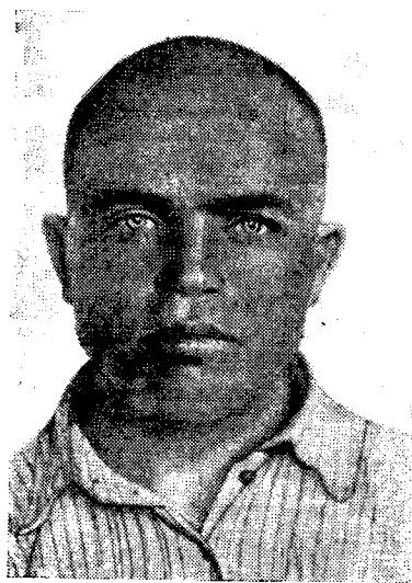
Рис. 2б. Светлый европеоидный тип (татарин Елабужского района)