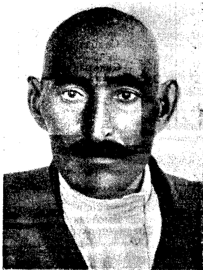
Рис. 1. Понтийский тип (мишарь Чистопольского района)

1) Понтийский тип (понтийская раса по Бунаку), характеризующийся мезокефалией, темной или смешанной пигментацией волос и глаз, высоким переносом, выпуклой спинкой носа с опущенным кончиком и основанием носа, значительным ростом бороды. Рост средний с тенденцией к повышению. Этот тип ярко выражен также у мишарей Наровчатского района Мордовской АССР, у западных черкесов, у крымских болгар и в восточной Болгарии у местного болгарского населения. Понтийскую расу В. В. Бунак относит к кругу средиземноморских рас 4 (рис. 1).