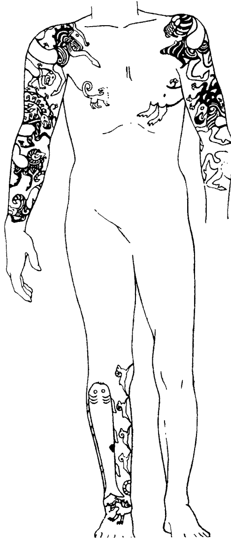
Рис. 2. Татуировка на теле "вождя" из второго Пазырыкского кургана (Руденко 1953. С. 137)

цирюльнику должны отрезать руку" (История Древнего Востока 2002: 184, 185). По всему видно, что в "вечном обиталище царственности", которым был провозглашен Вавилон, причинение телесного вреда наказывалось адекватной манипуляцией, т. е. казнью было повреждение тела провинившегося.