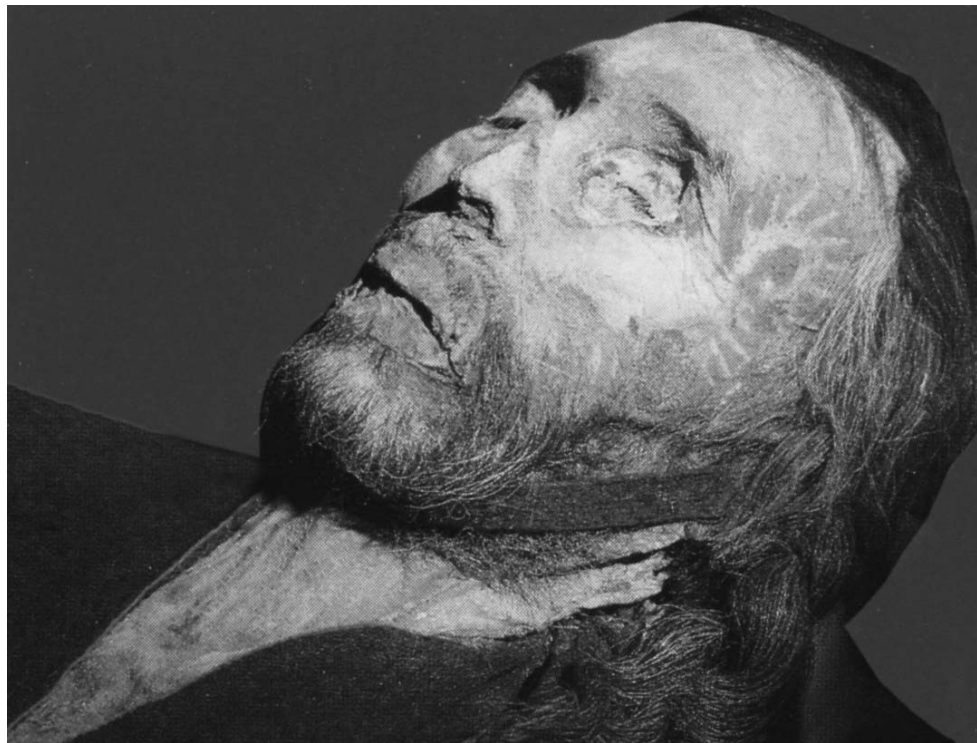
Рис. 1. "Солярный" знак татуировки на лице мужской мумии из пустыни Такла-Макан (Mair V. Mummies of the Tarim Basin // Archaeology. 1995. Vol. 48. № 2. P. 28)

попадающий в руки исследователей, более чем красноречив. Так, открытые уже более полувека назад татуировки пазырыкцев Алтая в свете новых уникальных находок 1990-х годов, получают новую интерпретацию. Они аргументированно рассматриваются не только как часть богатых традиций изобразительного искусства, созданного этим населением, но и как "сакральный текст", воплощение высшей племенной мудрости и наследие священных предков (Полосьмак 2001).