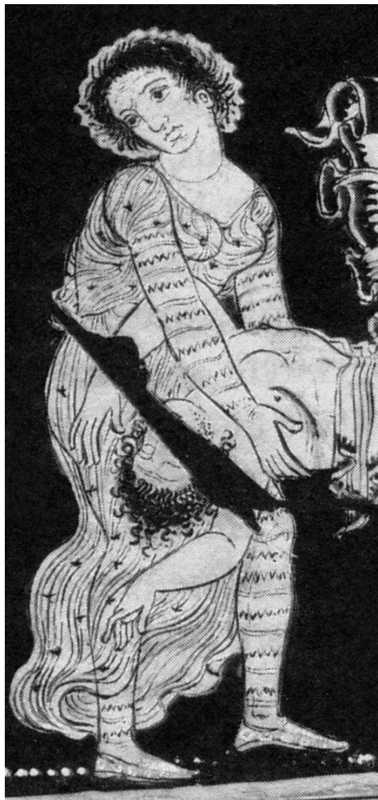
Рис. 3. Татуировка на теле фракийской женщины. Фрагмент греческого сосуда из Британского музея (Jones 2000. P. 3)

Другой греческий миф повествует о фракийском царе Ликурге. На иллюстрациях к мифу изображен кратер для вина из коллекции Британского музея (Апулия, ок. 350 г. до н.э.) и на нем татуированные женщины (Там же: 3). Анонимный античный источник IV в. ("Двойные аргументы"), на который ссылается К.П. Джонс, сообщает "для фракийских женщин быть помеченными [stizesthai] – украшение, но для большинства народов – это наказание преступников".