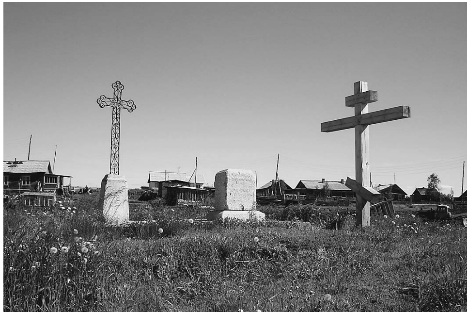
Старинное кладбище в Старотуруханске. 2005 г.

лор, не слух или красивая байка, это не художественная, а историческая память... Оно вообще очень отборчиво к факту и берет факт более значительный, переломный, подлежащий не украшателству, но передаче по цепочке..." ( Распутин 1991: 228).