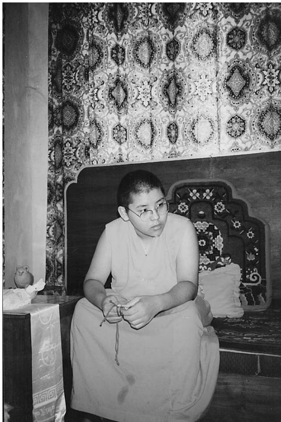
Линг Римпоче. Фото автора, 2006 г.

Линг Римпоче. Интересную историю о своем старшем наставнике Линге Римпоче поведал Далай-лама XIV. "Я всегда глубоко уважал Линга Римпоче, – пишет он, – хотя, когда был ребенком, боялся уже одного только появления его слуги, а всякий раз, когда слышал его знакомые шаги, у меня замирало сердце. Но со временем я стал ценить его как одного из наибольших и ближайших друзей. Когда Линг Римпоче умер, я почувствовал, что без него мне будет трудно жить. Он был той каменной стеной, на которую я мог опереться" ( Далай-лама 1992: 217).