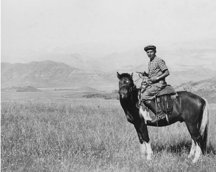
С.И. Вайнштейн в экспедиции в степях Центральной Тувы. 1959 г.