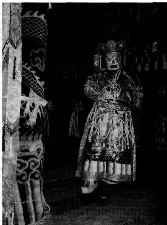
Цам Калачакра. Факультет Калачакра монастыря Гумбум Джамба лин. Фото автора, 2006 г.

цвета. Одновременно работают до 9–12 монахов. Насыпание мандалы начинается от ее центра и завершается на периферии.