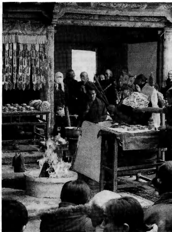
Ритуал "сжигание даров", посвященный Калачакре. Факультет Калачакра монастыря Гумбум Джамба лин. Фото автора, 2006 г.

"сжигание даров (жертв)", соответствует санскр. agni hotra ) – "дарование жертв огню, горящему [благодаря] дровам и пр." ( Цетан шабдрун и др. 1993: 2026). Тогда же осуществляется ритуал "сжигания даров", предупреждающее [вред] болезнетворных духов и восемь страхов" (Там же: 2386). Последние – это боязнь (страх) льва, слона, огня, змеи, реки, железных кандалов, грабителей, плотоядных (духов) (Там же: 899, 2386).