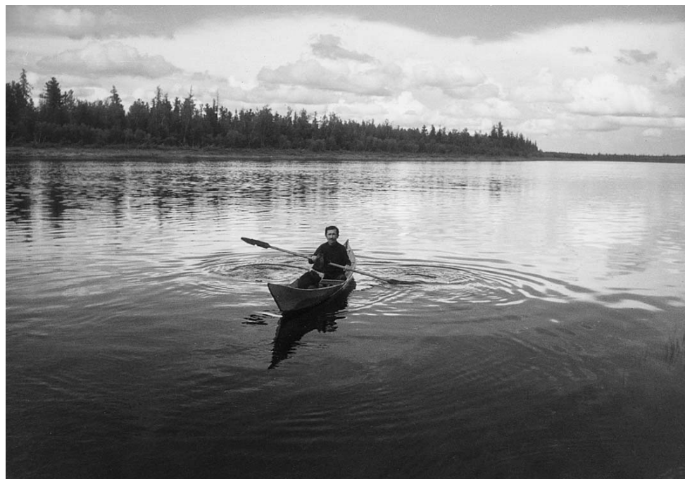
Рис. 2. Долбленая лодка (ветка).

ся. Это означает, что их влияние на уменьшение этнической самобытности кетов будет увеличиваться. К факторам, влияющим на дальнейшее распространение смешанных браков, относится переселение кетов в крупные, в основном русские по составу, поселки, где вероятность заключения смешанных браков неизбежно возрастает.