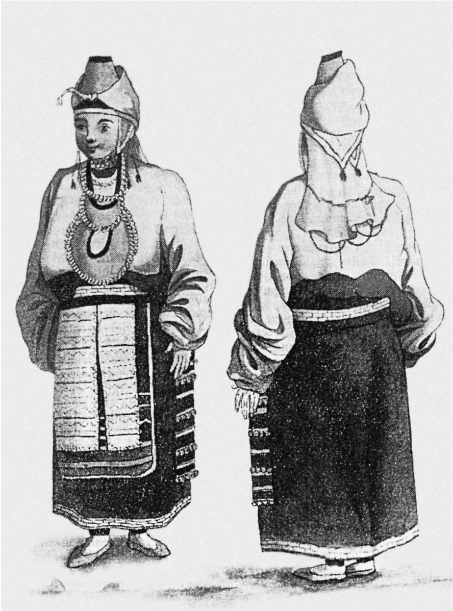
Рис. 3. Одежда чудской женщины. Рис. Ф. Туманского

их отродия: хотя и корене финскаго. ...Они свой род скрывая охотно соглашаются зваться ижерами. Но в том противоречит им их наречие, образ жизни, нравы, обычаи. ...Количество их больше нежели чюдей однако же не велико и главнейшия обитающа в селах Орле и Извозе” 33 .