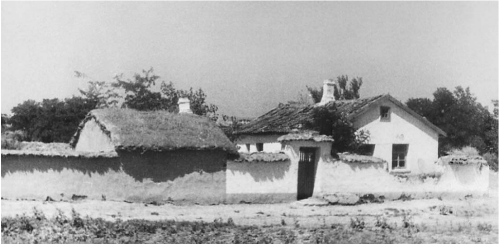
Рис. 5. Таманское жилище нового типа

Почти на каждом таманском дворе располагалась летняя печь для выпечки хлеба – плитка , конструкция и размеры которой могли быть весьма разнообразны (рис. 4). Иногда над плиткой воздвигали навес для защиты ее от дождя. Печь складывалась из кирпича и тщательно обмазывалась глиной. Круглая топка помещалась сбоку. Ширина внешней топки составляла до 42 см, внутренняя до 30 см. В плане печь была овальной: 90 × 70 см. Над топкой помещалось отверстие дымохода диаметром 20 см. Под печи выстилался кирпичом. Наибольшая окружность составляла 3,1 м. Рядом с печью обычно устраивалась яма для золы, диаметром 85 см и глубиной 45 см. Печь топилась соломой. После того как она прокаливалась, на под клалось тесто для хлебов, а топочное и дымоходное отверстия закладывались кирпичами и замазывались глиной.