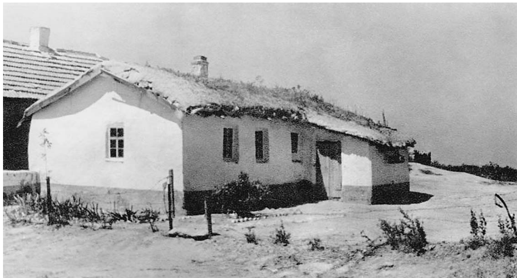
Рис. 3. Таманское жилище архаического типа

тельной просушки. За один день бригада выделывала до 1.500 штук саманного кирпича. На постройку одного дома употреблялось от 3.500 до 4.000 штук кирпичей.