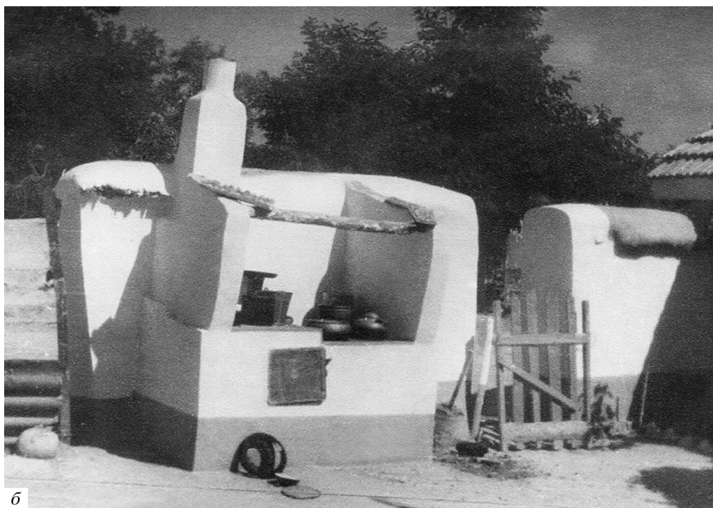
Рис. 4. Летняя печь для выпечки хлеба