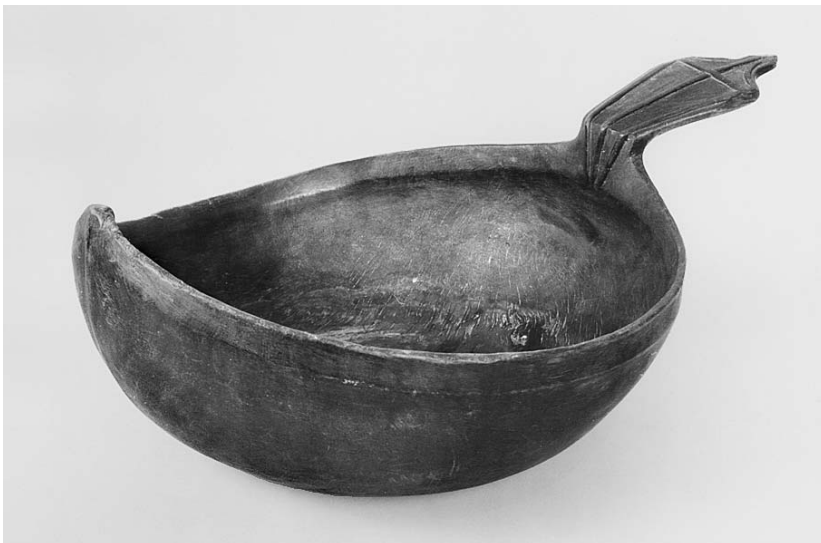
Рис. 4. Ковш для пива московского типа. XIX в. Вологодская губ., Вельский у., Чадроновская вол., д. Беляевская. Дерево. Гос. Исторический музей. Инв. № 67591 / К-1540

проводы призывников в армию местные жители варят пиво на собственной пивоварне или заказывают это сделать местному пивовару. По материалам ВОЙСК из Кадниковского у. Вологодской губ., выбор способа пивоварения зависел также и от состоятельности семьи: “Более состоятельные люди варят пиво на чане, менее состоятельные варят его в корчагах”. В Грязовецком и Вологодском уездах Вологодской губ., в Белозерском у. Новгородской губ. на “проводинах” рекрутов, помимо пива, пили чай и немного водки (“вина”) 55 .