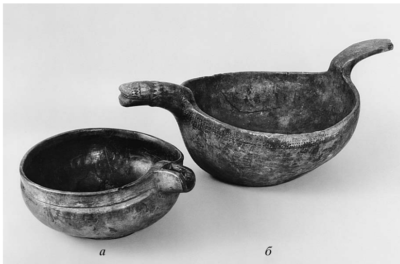
Рис. 1. а – Ендова. Начало XIX в. Архангельская губ., Пинежский у., с. Кобелево. Дерево. Гос. Исторический музей. Инв. № 64212 / К–1012; б – скобкарь “утка” для подачи пива. XIX в. Вологодская губ., Ракуло-Кокшеньгская вол. Дерево. Там же. Инв. № 67591 / К–1539

Родители жениха и невесты сначала договаривались между собой, сколько необходимо ведер пива заготовить и сколько водки купить, и за несколько дней до свадьбы начинали сами варить пиво. Возможно, в некоторых случаях заказывали приготовление пива за деньги другому лицу. Пиво было нужно не только для свадебного пира, но и во время всего предсвадебного периода. Минимальное количество напитков только для просваток или пропивания невесты (до свадьбы) составляло примерно десять ушатов пива и одно ведро “вина” (водки), а у богатых женихов на просватках было до двадцати ушатов пива и до трех ведер вина. Корреспондент Е. Кичигин сообщал, что в г. Тотьме родители невесты могли условиться со сватом, какое количество ведер пива он выставит на просватках ( пропиванье ) невесты. К самой свадьбе, как заметила В.А. Липинская, варили очень много пива – до 200 ведер 10 . Такие большие объемы этого напитка было возможно приготовить только на пивоварне.