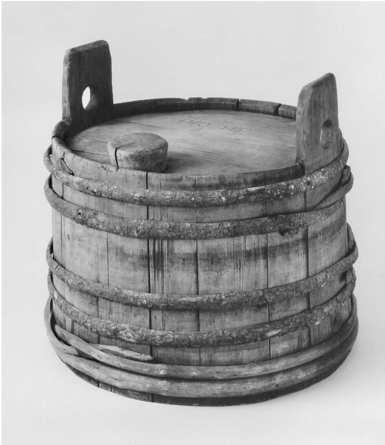
8Рис. 3. Бочка лагун. Конец XVIII в. Архангельская губ., Пинежский у., с. Покшеньга. Дерево. Гос. Исторический музей. Инв. № 64212 / К-995

копейки. Собранные из енды деньги отдавали девушкам, подругам невесты. Затем дружка произносил еще один наговор, подобный приведенному выше, и всех гостей снова обносили пивом 36 .