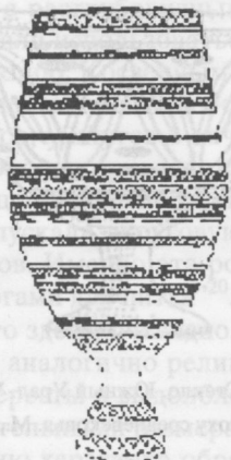
Рис. 1. Чорон. Дерево. Якутия. (Потанов И.А. Якутская народная резьба по дереву. Якутск, 1972. Рис. 10.)

лы, как правило, украшались одним, двумя или тремя валиками, “веревочкой” или “зигзагом”, иногда с добавлением крупных дуг, ромбов, треугольников, выпуклых точек, а в единичных случаях – букраниев или пальметок 5 . Столь явные несоответствия заставляют исключить котлы скифо-сибирского мира из прототипов чоронов.