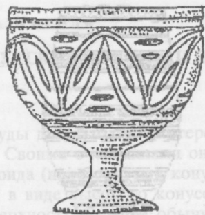
Рис. 2. Кубок. Стекло. Южный Урал. V–VII вв. н.э. (Степи Евразии в эпоху средневековья. М., 1981. Рис. 13, 46 .)