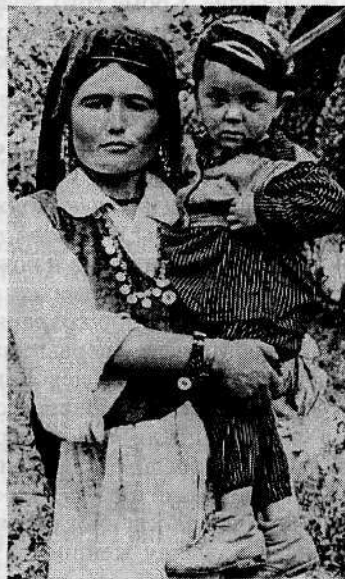
Рис. 3. Костюм мальчика. Кишлак Камчин (Варзоб). 1980-е годы

щение, если ребенок не умрет. Подобная косичка называлась кокули назри (букв. «косичка, обещанная по обету в жертву»). Такой ребенок считался должником Бога 3 . Обычно обет давался тому мазару, к которому обращались с целью «вымолить» ре-