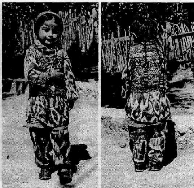
Рис. 2. Костюм и прическа девочки. Кишлак Зидды. 1980-е годы