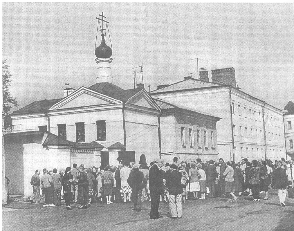
Рис.5. В ожидании открытия Музея Мологского края. Август 1995 г. Город Рыбинск.

двухэтажное здание и парк, приспособленные для занятий различными видами спорта. «Манеж», вмещавший до 800 чел., использовался и для других массовых мероприятий – детских елок, концертов, показа спектаклей любительским театральным коллективом, существовавшим в городе с середины XIX в.