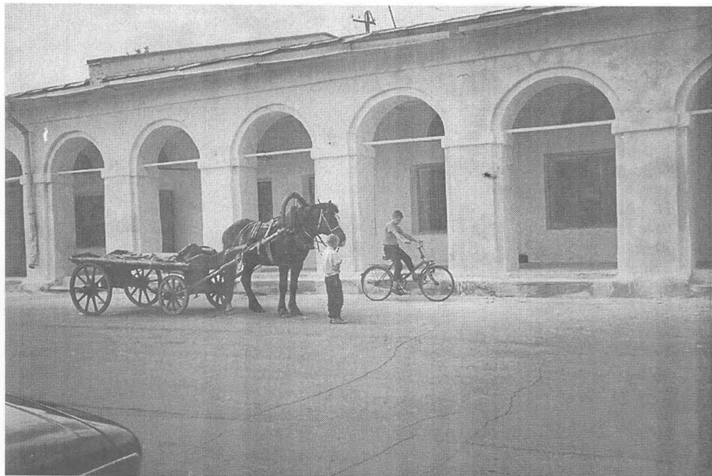
Рис.2. У торговых рядов на площади Свободы. Фото 1999 г. О. Будины

ной своим благоустройством. А «по народонаселению Пошехонье можно отнести к числу средних русских уездных городов, и он с годами растет» 2 . В Пошехонье в 1861 г. насчитывалось 3733 чел., в 1897 г. – 4 тыс., в 1926 г. – 4,3 тыс., в 1979 г. – 7,6 тыс., в 1989 г. – 8 тыс. и в 1999 г. (на 1 января) – 7,4 тыс. чел. Приведенные цифры показывают, что город рос, и в XX в. его население по сравнению со второй половиной XIX в. удвоилось, хотя в 1990-е годы отмечалось некоторое сокращение численности. Вместе с тем Пошехонье, население которого не достигает 12 тыс., не вполне соответствует требованиям, предъявляемым к городам (согласно законодательству РФ, не менее 12 тыс. жителей – один из признаков, определяющих принадлежность населенного пункта к разряду городов). Тем не менее подобных городов, имеющих нередко древнюю историю, в России много и все они включены в общее число городов.