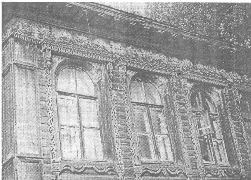
Рис.4. Фрагмент верхнего этажа дома с деревянной резьбой по ул. Терешковой. Фото 1996 г. Т. Снегиревой

мне представлялось обратить внимание на факт жизнестойкости, которую демонстрирует российская провинция, переживая очередной переломный период истории. На помощь ей, по всей видимости, приходят сложившиеся на протяжении веков традиции, которые продолжают функционировать в той либо иной форме в различных областях жизни – как в материальной, так и духовной ее сферах.