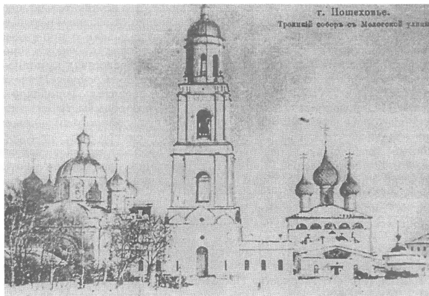
Рис.3. Изображение Троицкого собора на почтовой карточке начала XX в.

За время своего существования школа «Озарение» получила известность не только в Пошехонье. В Ярославле она стала обладательницей нескольких дипломов за те либо иные достижения в творчестве. В начале 2000 г. школьный философский клуб «Шаг» участвовал в областной ярмарке клубных подростковых объединений, где имел успех. Воспитанники «Озарения» по приглашению выезжали со спектаклями в города Данилов и Тутаев. В своем же городе и районе учащиеся, как уже говорилось, приняли участие в «Баловских чтениях». В конце 1999 г. были организованы «Малые Баловские чтения» – исключительно для школьников города и района. Из 16 докладов на краеведческие темы некоторые были подготовлены воспитанниками школы «Озарение». Другие чтения – «Рождественские поэтические», инициатором которых стала школа «Озарение», уже второй год (1999 и 2000 гг.) успешно проходят в Пошехонье. Увеличилось число участников – поэтов и чтецов (свыше 50 чел.), среди которых много «озаренских» учеников.