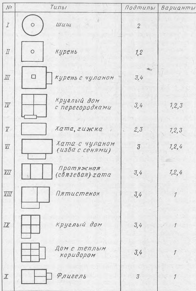
Рис. 1 Типы традиционных жилищ донских казаков

жилом помещении (хате) сохранялась «диагональная» структура внутреннего пространства. Термин дом , как уже говорилось ранее, был призван отметить большие размеры и многокомнатность этого вида построек, а прилагательное круглый лишней раз закрепляло значимость такого признака, как форма построек, что между прочим не позволяет считать это жилище лишь вариантом построек с капитальными стенами, а требует выделения его в качестве таксома более высокого уровня.