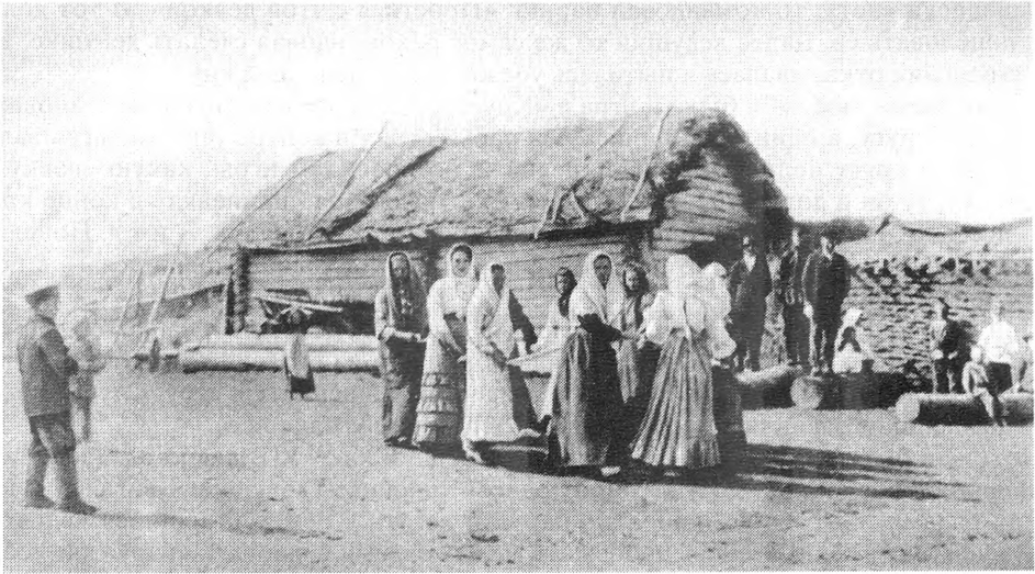
Рис. 4. Хороводы девушек-сибирячек. 1911–1913 гг.

детей. Мужчины на Троицу играли в подвижные игры: «бить-бежать», «мечик», боролись 22 .