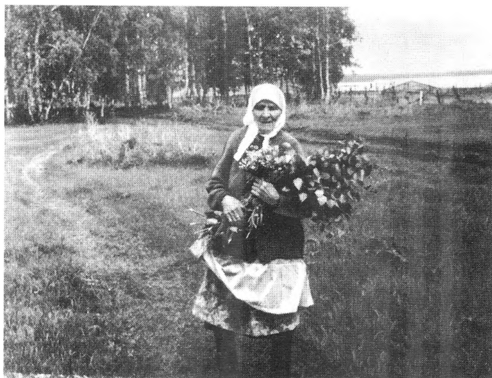
Рис. 3. Собираение троицких венчиков и цветов (с. Усть-Луковка Ордынского р-на). 1995 г.

Кроме обычаев, связанных с березами, в семьях с южнорусскими и украинскими корнями утром на Троицу было принято собирать травы, цветы. Букетики зелени несли на кладбище, ими же застилали полы изб и хозяйственных построек («А бы зелень была!»). В памяти людей сохранились веселые припевки: «Скоро Троица – земля травой покроется!» или «Троица – зеленый сад откроется!». Среди сибирских украинцев до сих пор бытует убеждение, что в эти дни все должны ходить по траве. Даже старожилы, которые могли и не устилать дома зеленью, все же украшали внутренние помещения (горницы) букетиками цветов. Среди троицких цветов было много желтых, например одуванчики, лазоревые. Вплетали в букеты также самсончики, медуницы, богородскую траву (чабрец), незабудки, кукушкины слезки. Многие цветы и травы имеют местные названия, поэтому их трудно идентифицировать с принятыми в современной лексике: «Костер-траву бросали на пол. Шкенды, кудряшки, саранки, медунки, руськи... разные святые» 14 . Наряду с березовыми венчиками запаривали троицкие травы: богородскую траву, ромашку, листья клубники – и этим отваром ополаскивали голову, чтобы «не болела».