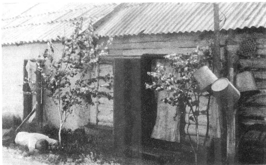
Рис. 2. Установка берез во дворе дома (с. Сушиха Ордынского р-на). 1994 г.

попрется!»; «Так по закону делали старые люди и мы делаем!». Объясняют эти обычаи и эстетическими потребностями.