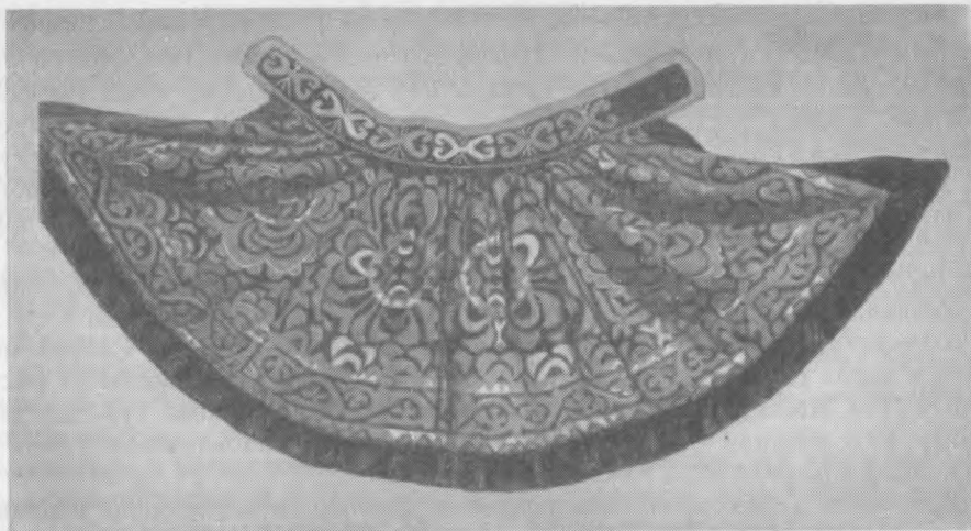
Рис. 1. Киргизские белдемчи

ных народов и говорить об ираноязычном кочевническом скифо-сакском субстрате в их этногенезе. Опираясь на этнографические характеристики этого головного убора и сведения других источников, приходишь к выводу, что на ираноязычный кочевнический компонент в этногенезе современных казахов, киргизов, каракалпалков, дештикипчакских узбеков и ряда народов вне изучаемого региона (например, башкир) указывают древний изобразительный и археологический материал, сообщения древних авторов, современные этнографические и лингвистические свидетельства 2 . Этот вывод, сделанный на основе изучения только головного убора, тем более значителен, что другие исторические источники приводят к таким же заключениям, относящимся к особенностям этногенеза названной группы народов.