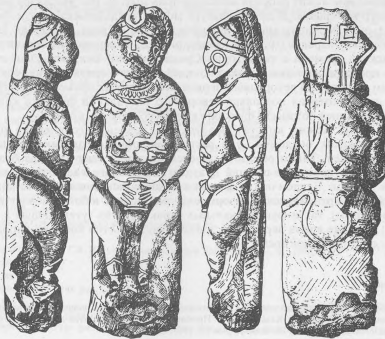
Рис. 4. Женская статуя с ребенком (прорисовка по таблицам С.А. Плетневой)

Итак, знакомство с костюмом половецких каменных изваяний позволило нам установить наличие как в мужском, так и в женском комплексах распашной юбки, носимой поверх верхней одежды. Возможно, этот элемент костюма был свойствен определенной социальной среде – военной, хотя наиболее част он в женском комплексе.