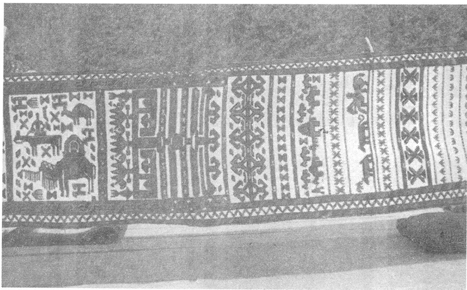
Рис. 1. Иомутская дорожка голан

вещей женщины ткнут небольшие настенные коврики с кистями, чехлы на кресла и на сиденья в автомобилях, седла для мотоциклов и велосипедов, женские сумочки и т.д.