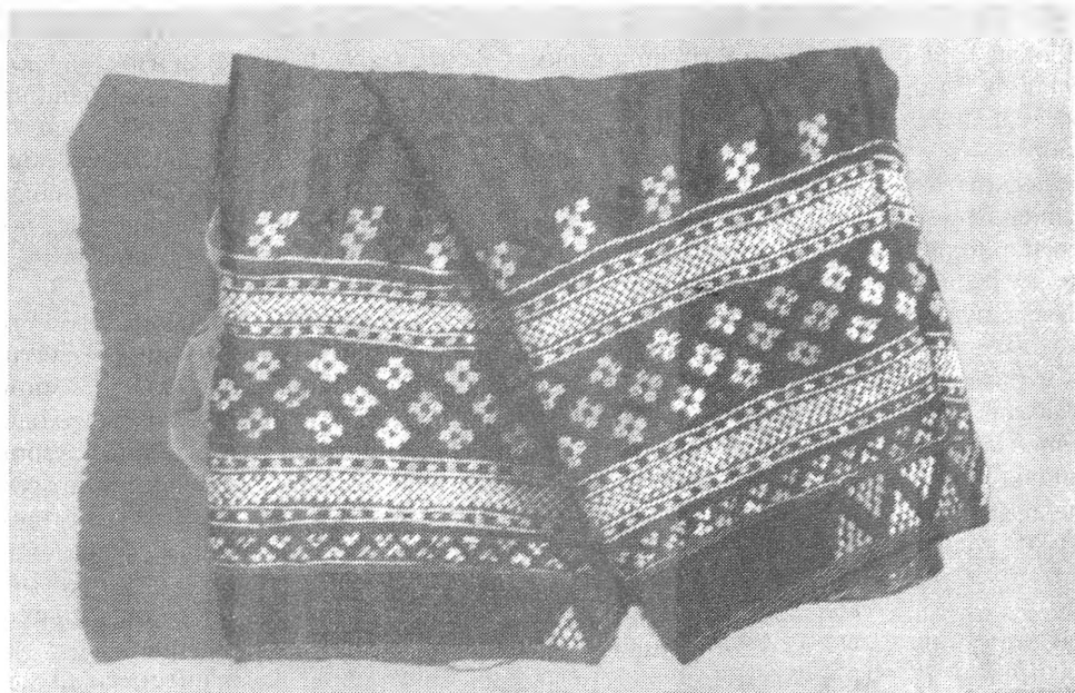
Рис. 3. Нижний край женских штанов

традиционного покроя: все шире используется туркменская вышивка для украшения платьев как модернизированного национального, так и городского покроя, дамских сумочек, мужских галстуков, ремешков для часов, мужских модных белых рубашек и т.д.