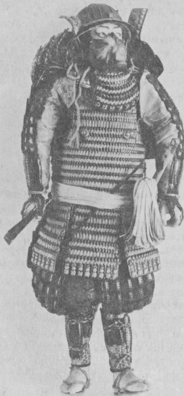
Рис. 2. Кукла самурая. Япония XIX в. Подарок барона Штакельберга 1893 г.

Возникновение оригами, вероятно, можно отнести к VI в. н. э., когда в Японию из Китая была завезена бумага. Бумажные фигурки постепенно распространились в быту японцев, а само искусство складывания стало частью традиционного семейного досуга. Сами японцы считают оригами не только суммой определенных навыков работы с бумагой, но и важным элементом национальной культуры.