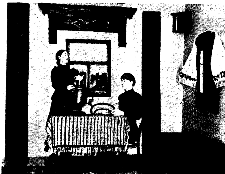
Рис. 2. Фрагмент экспозиции «Чаепитие» из раздела «Русское население Саратовской губернии»

1993 г. На выставке экспонируется около 400 подлинников и фотографий. Это орудия труда, национальная одежда, предметы декоративно-прикладного искусства. На фотографиях можно видеть жителей Саратовского края начала XX в. Экспозиция знакомит посетителей с занятиями, культурой и бытом русских, украинцев, немцев, мордвы, чувашей, татар и калмыков. На выставке представлены ножной гончарный круг и керамика, изящная домовая резьба русских и грубоватая по исполнению деревянная утварь чувашей, чувашское тончайшее