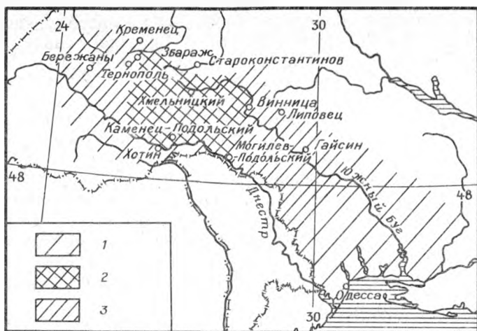
Рис. 1. Динамика территории Подолья (1 — территория «Земли Подольской» (XIV—XV вв.); 2 — территория Подольского воеводства (XVII—XVIII вв.); 3 — территория современного Подолья как историко-этнографического региона Украины)

служили естественные барьеры, чаще всего реки, иногда болота или горные кряжи, создававшие дополнительные (помимо административных границ) препятствия для общения населения. Так, естественными границами Подольской губернии XIX в. на севере служили р. Горынь и Кременецкий кряж, отделявшие ее от Волыни; на востоке реки Жердь и Ятрань отграничивали Подолье от Киевской губернии; на юго-востоке реки Синюха и Кодыма служили границей с Херсонской губернией; на юге Днестр отделял Подольскую губернию от Бессарабии, а на западе р. Збруч — от Галиции.