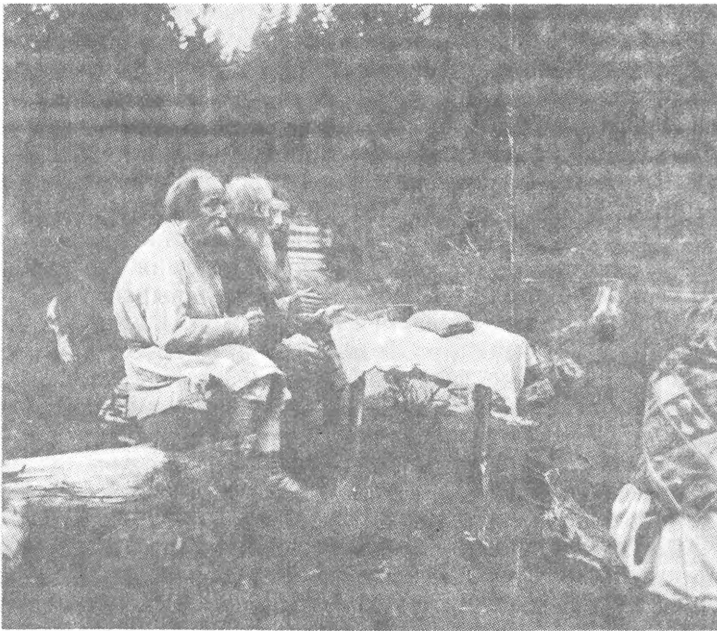
Рис. 3. Жрецы, приносящие жертву Нюлесмурту (божеству леса) Окрестности с. Бодья Сарапульского у. Вятской губ.