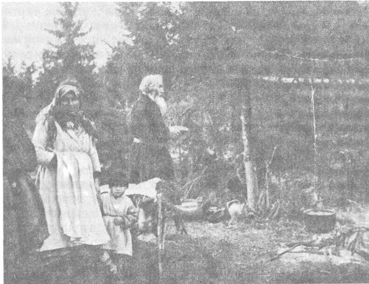
Рис. 4. Жрец, обращающийся к Нюлесмурту с жертвой в руках Окрестности с. Бодья Сарапульского у. Вятской губ.

Двумя годами ранее И. К. Зеленев ездил на самый север в Тобольскую губ. по поручению Русского музея тоже с целью изучения быта манси. Но это была кратковременная поездка.