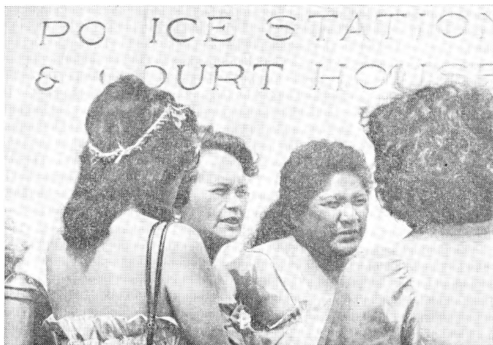
Рис. 6. Гавайские женщины у полицейского участка

между людьми, их культурой и окружающей средой. Эта этика была непосредственно заимствована из гавайской культуры» 12 .