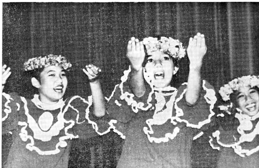
Рис. 5. Детский гавайский ансамбль

в общеамериканской культуре естественными и неизбежными в исторической эволюции островитян. Такой подход даже трудно рассматривать в контексте гавайского движения, ибо он по своей сути носит антигавайский характер. Есть также довольно многочисленная категория гавайцев, особенно из среднего класса и интеллигенции, для которой главной целью является возрождение, развитие гавайской культуры в рамках существующей социально-политической системы. Это своего рода мелкобуржуазное либеральное течение, напоминающее по своей природе хорошо известные лозунги культурной автономии. Наконец, существует радикальное крыло, с которым чаще всего связывают понятие гавайского национализма. Программа радикалов включает требование национального суверенитета гавайцев на основе их исконных прав на землю, а само понятие «суверенитет» или «самоопределение» мыслится или как существование некоего автономного образования в границах США («нация внутри нации»), или как отделение и провозглашение самостоятельного государственного образования при исключительном или преобладающем контроле со стороны коренных гавайцев.