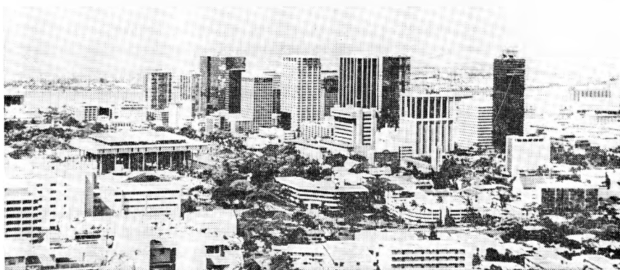
Рис. 1. Вид Гонолулу

39 тыс., Ниихау — 0,2 тыс. человек, острова на северо-западе архипелага — 31 человек; на о-ве Мидуэй и атолле Джонстон, формально не входящих в состав штата, — соответственно 453 и 327 человек. Современные Гавайи — урбанизированное общество: горожане составляют 86,5% населения штата. Это прежде всего жители крупнейшего города и столицы Гавайев Гонолулу, население которого в 1985 г. уже превысило 800 тыс. человек. Расположенный у подножия горы Даймондхед на южном (подветренном) берегу Оаху город сосредоточил основные деловые и административные учреждения, туристские и жилые постройки (рис. 1). Его обращенная к знаменитому пляжу Ваикики часть представляет собой цепь многоэтажных отелей, ресторанов и магазинов, обслуживающих туристов. Туризм за последние 20 лет превратился в важнейшую отрасль островной экономики. В 1984 г. Гавайи посетило около 5 млн. туристов, в том числе 3,2 млн. из других штатов США и 816 тыс. из Японии.