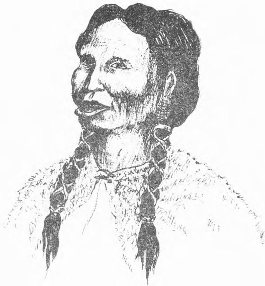
Рис. 2. Тлинкитка с деревянной «калужкой» — втулкой, вставленной в разрез под нижней губой. Рис. автора статьи

Рассказывая о материальной культуре тлинкитов Якутата, Тарханов особенно подробно останавливается на описании их одежды и украшений. Мужчины, по его свидетельству, носили в конце XVIII в. длинные рубахи из шкур пушных зверей («парки») и накидки из шкур медведей и сурков, а также из разноцветного сукна, выменянного у английских торговцев. Зимой этот костюм дополнялся теплым меховым плащом, а на ноги надевали штаны и «торбасы» — сапоги из дубленой тюленьей кожи, на руки — рукавицы, а шею обвязывали своеобразным «шарфом» из шкурки пушного зверя. Еще одна такая шкурка, повязанная вокруг головы, служила зимней шапкой. Внутри дома мужчины ходили только в набедренных повязках. Каждый из них постоянно имел при себе кинжал в лосиных ножнах. Обычным оружием были также лук со стрелами и копьё. Говоря о защитном вооружении воинов, Тарханов упоминал типичные тлинкитские доспехи в виде кирасы из деревянных дощечек и палочек, оплетенных китовыми жилами. Поверх этих деревянных «лат» надевалось по две рубахи из толстой лосиной кожи, предохранявшие воина от вражеских стрел. Дополнительной защитой служили тяжелый резной деревянный шлем и забрало 59 .