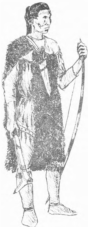
Рис. 1. Индеец атена. В правой руке у него костяной томагавк из рога оленя-карибу; на шее висит кинжал в лосиных ножах. Рис. автора статьи

тили на земле планы этого района, которые Тарханов затем, переспрашивая предварительно несколько раз информаторов, перенес на бумагу. Согласно сообщениям медновцев, в верховьях реки жили некие «келхени» в восьми бараборах, каждая из которых отстояла от другой на «день пути». По подсчету Тарханова, ближайшая барабора келхеней располагалась от последнего жилища медновцев в 45—50 верстах вверх по Медной реке. «Зимой,— писал Тарханов со слов медновцев,— выходят [келхени] к озеру Балтыбеле. Имеют торг с проходящими с другого жила Нечиль [людьми], которые по показанию медновских крест кладут с левого плеча. Поторговавшись, [те люди] уходят обратно в свое место, а келхени остаются у онаго озера и имеют промысел пушных разных зверей, сохатых, оленей» 48 .