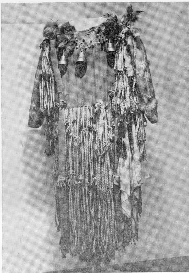
Рис. 3. Плащ алтайского шамана — один из экспонатов выставки

Среди других вещей повседневного обихода, имевших большую культурно-историческую ценность, следует упомянуть казахский таган (конец XIX — начало XX в.), украшенный в местах соединения ножек с обручем изображениями бараньих головок (сакская традиция) и казахский «бакан» (шест для подъема купольного круга юрты) в виде покрытой резьбой и раскрашенной доски (XIX в.). В том же зале, где стояла юрта, демонстрировались среднеазиатские ковры и узорные войлоки.