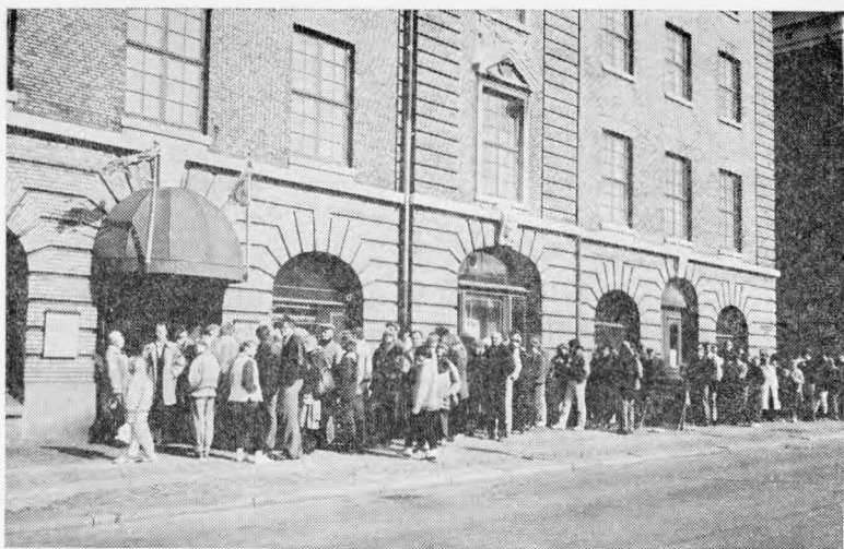
Рис. 1. У входа в Гетеборгский исторический музей в один из дней выставки

Тува) раскрывали перемену в представлениях о душе и загробной жизни. Если в скифо-сакский период в могилу для мертвого клали преимущественно настоящие вещи, чтобы он пользовался ими в потустороннем мире, то в гуннский период широко распространилось убеждение, что покойнику для его новой жизни достаточно моделей нужных ему предметов.