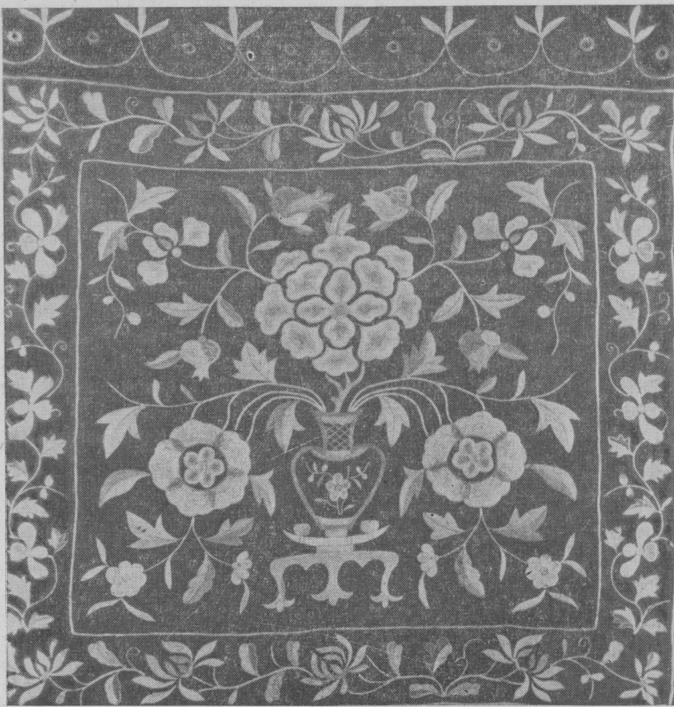
Рис. 2. Конец полотенца. Вышивка тамбуром (1920 г.)

ный характер. Продолжают широко бытовать вышивка, резьба по дереву, изделия из тыквы-капак.