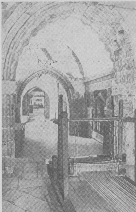
Рис. 2. Интерьер музея

ткани и изделия из них. Основным материалом для их изготовления являются хлопок, лен, шерсть, шелк. Поражает разнообразие цветных льняных тканей, они собраны практически со всех уголков острова. В этом разнообразии преобладают желтый, светло-зеленый, темно-синий, серый и красный — цвета, традиционные для женской одежды Кипра. Они чаще других встречаются и в экспонируемых в следующих залах предметах одежды. Значительно беднее представлены шерстяные ткани, что вызывает некоторое удивление, если вспомнить о том, что на острове развито овцеводство и вырабатывается относительно много шерсти. Шелковые ткани занимают скромное место в экспозиции, хотя шелководство — традиционная отрасль хозяйства Кипра. Возможно, это связано с тем, что ныне кипрское шелководство переживает упадок, оно не может конкурировать с искусственным шелком. Утратили славу традиционных центров производства натуральных шелковых тканей Никосия и Лапидос.