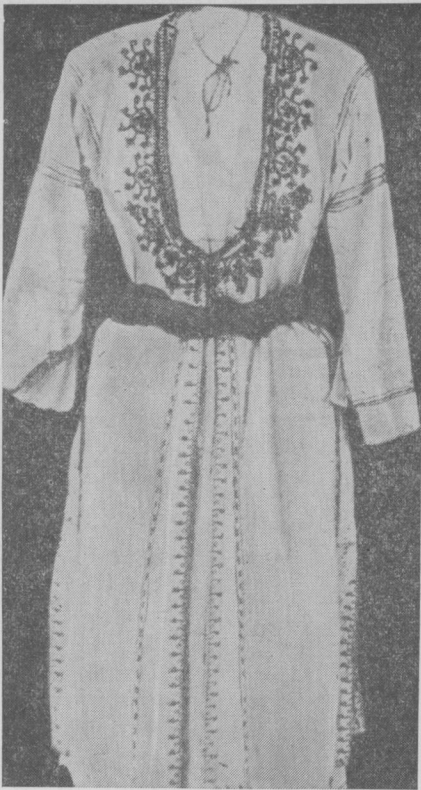
Рис. 3. «Сагиес» — национальная женская одежда, украшенная вышивкой

(в этом мы убедились, посетив деревню Акаки, расположенную в 40 км от Никосии).