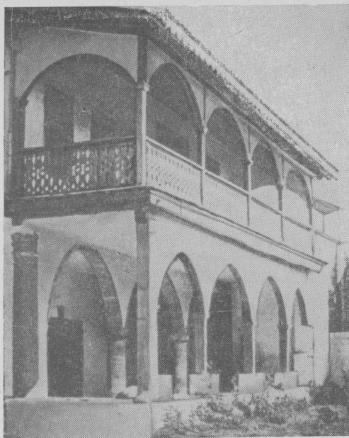
Рис. 1. Общий вид Музея народного искусства Кипра

сетителей, и о существовании музея в Никосии, а тем более за ее пределами знали немногие. В 1961 г. для архиепископа была выстроена новая резиденция, и благодаря стараниям Общества кипрских исследователей здание прежней Архиепископии было передано обществу. С тех пор Музей народного искусства занимает весь первый этаж старой Архиепископии, и его экспонаты размещаются в 14 залах. Правда, залами помещения можно назвать лишь условно — это небольшие кельи бывшего мужского монастыря XV в., принадлежавшего Бенедиктинскому ордену. Само здание является памятником архитектуры, и это обстоятельство стимулирует интерес жителей Никосии и многочисленных туристов к музею. К тому же здание музея нахо-