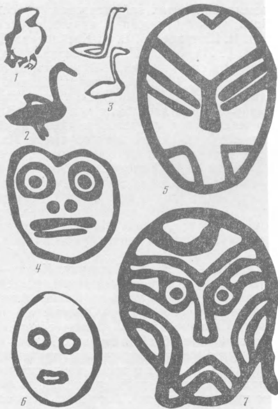
Рис. 1. Петроглифы Амура и Уссури: 1, 4, 7 — Сакачи Аляя; 2, 3 — Шереметьевское

щины (рис. 2, 5). Пол первых людей: Шанвай, Шанкоа, Шанка в тексте мифа не оговорен (возможно, это зооморфные существа) (рис. 2, 1, 6), допустимо предположение, что три сохранившиеся личины — это стрелок Кадо (Ходай), его жена Джулчи и дева (сестра) Мамилжи (Мяменди). В таком случае личина с продолговатыми глазами («рыбками») — мужская (рис. 2, 2), а две личины с круглыми глазами — женские (рис. 2, 3, 4). Одна из женских личин, как и мужская, имеет сердцевидную форму, другая — овальную. По какому признаку: родство (сестра) или брак (жена) сближены мужская и женская личины 14 , мы не знаем, но вероятнее по признаку брака. На отсутствующих частях вазы могли быть изображены и остальные персонажи мифа: Шанвай, Шанкоа, Шанка, лебеди, солнца (вороны — или змей? — змей-супруги ассоциировались с солнцем у айнов 15 ). Ваза в целом — ритуальный сосуд с иллюстрациями мифа о солнечном стрелке. Если догадка автора получит новые подтверждения, вознесенская ваза станет ключом к дешифровке части петроглифов. С «личиною Кадо» сближаются изображения Сакачи-Аляя, показанные А. П. Окладниковым в книге «Петроглифы Нижнего Амура» на таблицах 25, 26, 62, 64, 82, 85, 98, 115, 116, и Шеметьевского (таблицы 124, 131), к изображению «жены Джулчи» близкие таблицы 57, 117 (?), 124; «сестры Мамилжи» — 19, 21, 63 (рис. 1, 4—7) 16 .