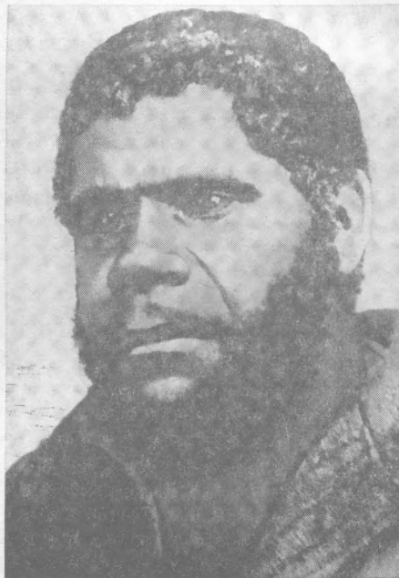
Рис. 1. Уильям Лэнни

Последние годы жизни Труганини были отравлены страхом: она боялась, чтобы тело ее не было бы после смерти обрублено и покалечено, как труп Уильяма Лэнни. Незадолго до смерти, наступившей 8 мая 1876 г., она просила врача: «Не разрешайте им разрубать меня, похороните меня за горами» 23 . Ей обещали это, но обещание нарушили. Правда, ее похоронили тайно в Хобарте, но через два года скелет ее был эксгумирован и перевезен в тасманийский музей. Кости ее хранились в подвале в старом ящике из-под фруктов и были вновь обнаружены там только в 1890 г.