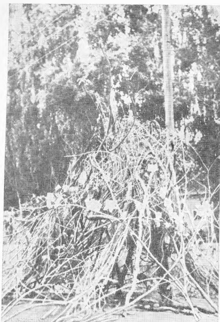
Рис. 1. Костер на ул. Кирова

костры, а на следующий день обливают друг друга водой. Обычай обливания, по свидетельству студентов, существует и в других русских селениях.