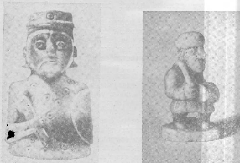
Рис. 1. Шахматные фигуры, кость, XII в.: а — царь (Берестье), б — пешка (Волковыск)

в этом следует искать и корни повышенного внимания к ней со стороны творческой интеллигенции. В начале прошлого столетия И. А. Бутримов, автор первого в России учебного руководства о шахматах, писал, что они составляют любимую игру «славнейших людей: военных, видящих в сей игре науку войны, и мудрецов, находящих ее достойной ума своего» 12 .