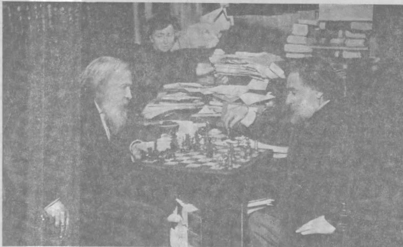
Рис. 4. Д. И. Менделеев (слева) играет в шахматы с художником А. И. Куинджи (Петербург)

рой на долю человека. Это также не раз отмечал Л. Н. Толстой. Он говорил: «За игрой мы отдыхаем от работы и забываем о своих невзгодах» 24 .