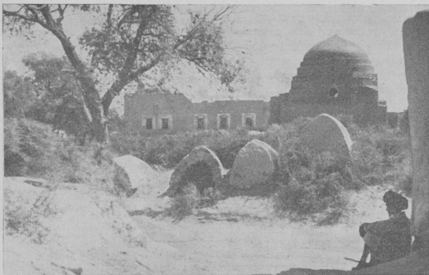
Рис. 4. «Минувшее...» (Куны-Ургенч, 1955 г.)