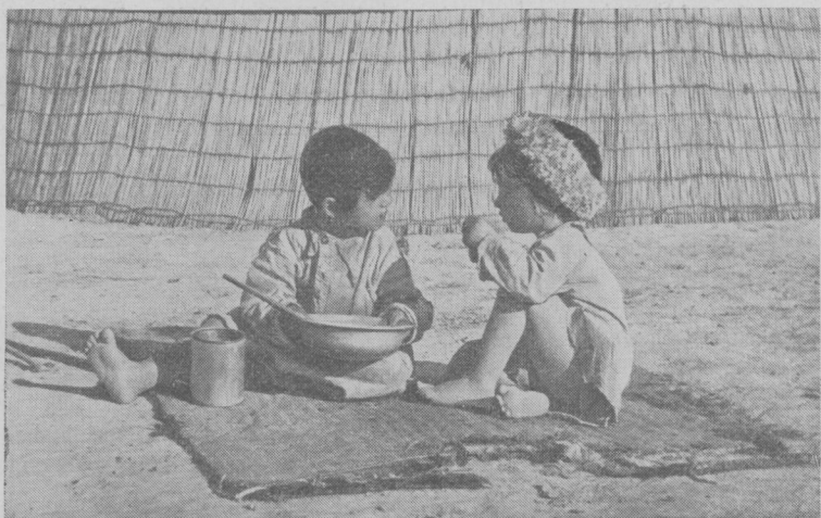
Рис. 5. «Интересные новости» (Туркмения, 1968 г.)