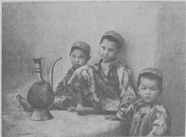
Рис. 1. «Три сестры» (Туркмения, 1950 г.).

В январе 1980 г. в помещении Института этнографии АН СССР открылась выставка фоторабот Г. А. Аргиропуло, посвященная его 70-летию. Г. А. Аргиропуло работает фотографом в Институте этнографии свыше 30 лет. Он неизменно принимал активное участие в полевых исследованиях, проводившихся в разных частях нашей страны — в Прибалтике, в Сибири, в Средней Азии, на Кавказе. Его творчество заняло видное место в издательской деятельности института. Фотоснимки Г. А. Аргиропуло иллюстрируют многие книги, вышедшие в свет с грифом Института этнографии, в том числе такой капитальный обобщающий труд, как многотомник «Народы мира». Фотоматериалы Г. А. Аргиропуло, существенно дополняющие полевые записи этнографов, составили значительную часть институтского фотоархива. Своим богатым опытом большой мастер всегда охотно делится с молодыми этнографами, вступающими на путь самостоятельных полевых изысканий. Выставка Г. А. Аргиропуло, привлекая к себе внимание сотрудников как Института этнографии, так и ряда других институтов Академии наук СССР, стала своего рода отчетом автора о работе за минувшие годы и заметным событием в научной жизни института.