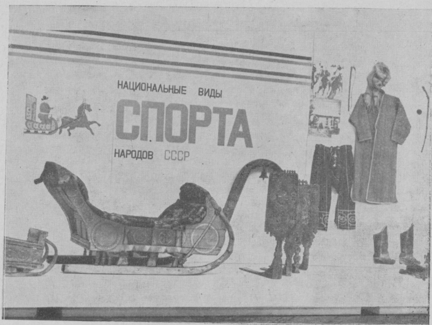
Рис. 1. Один из разделов выставки «Национальные виды спорта народов СССР»

Для силовых состязаний у народных тяжелоатлетов не было специальных спортивных снарядов. Вместо них использовались камни, бревна, тяжелые предметы, орудия труда. Позднее широкое развитие получает гиревой спорт. В данном разделе выставки представлены фотографии, изображающие поднятие плуга и церковного колокола кавказскими богатырями, различные моменты состязаний гиревиков, демонстрируются и такие разновидности силовых состязаний, как перетягивание каната, палки, якутская игра хаях-хостосу, заключающаяся в поочередном отрывании от дерева людей, сцепившихся цепочкой.