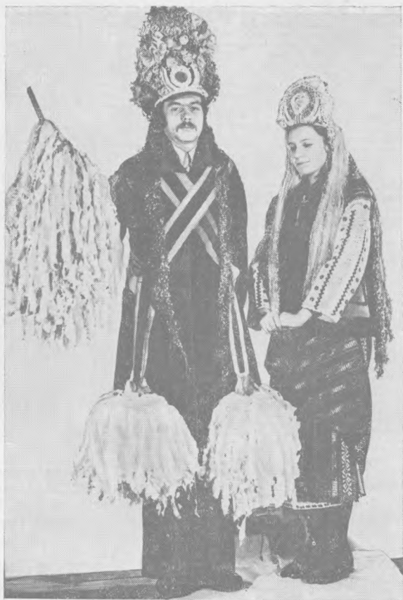
Рис. 5. Главные персонажи «Маланки» — Император (ГМЭ, № 8424—11) и Катюша (ГМЭ, № 8424—14), МССР, Бричанский р-н, с. Коржеуцы

вни деталей и смене материалов, из которых выполняют обязательные атрибуты. Более того, представляется возможным выделить несколько временных пластов в современных костюмах героев народной драмы. Наиболее древний пласт представлен стабильным национальным костюмом, полный комплект или только верхняя одежда которого составляет до сих пор основу костюма любого персонажа (Император, Катюша, Эрины). Эполеты, перевязи, головные уборы традиционной формы появились в Молдавии в XVIII в. и представляют следующий этап в развитии костюма, когда на территории Молдавии появились по-европейски обмундированные русские войска; позднее влияние на костюм оказало проникновение сюда русской драмы «Царь Максимилиан» 36 . И верхний, самый подвижный пласт в настоящее время находится в постоянном изменении, так как процесс переосмысления функций персонажей продолжается (отсюда, например, появление в традиционных головных уборах современной геральдики), чему способствует в определенной степени быстрая смена материалов для украшений. Аналогичное явление в плане переосмысления функций можно наблюдать и в чрезвычайно интересной, но значительно менее изученной народной драме «Нунта» («Свадьба»), занимающей, с нашей точки зрения, промежуточное место между «игрищами» и собственно драмой. Главные персонажи ее: старик