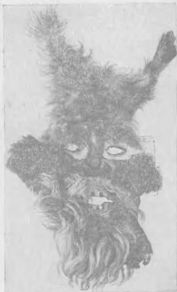
Рис. 7. Маска черта — персонажа «Нунты», УССР, Черновицкая обл., Глубокский р-н, с. Волока (ГМЭ, № 8424—40)

( мошул ) и старуха ( баба ), жених ( мире ) и невеста ( мирясэ ), свекор ( сокру-маре ) и дружка ( батэжелул — друг жениха), доктор ( докторул ), медведь ( урсул ) и черт ( дракул ) — издавна участвовали в представлениях, связанных с культом плодородия. В настоящее время «Нунта», утратив магический смысл, превратилась в праздничное действо, но в ней сохранились традиционные костюмы и некоторые атрибуты. Особое место этой драмы обусловлено наличием в ней персонажей, характерных как для «игрищ» (медведь, черт), так и для драмы (жених, свекор, доктор и др.). Маска медведя (рис. 6) сделана так же, как маска быка: деревянный каркас обтянут шкурой, глаза-пуговицы, уши из жести (использованы крышки больших консервных банок). Ряженный надевает маску и шубу, вывернутую мехом наружу, либо специально сшитые меховые штаны и куртку.