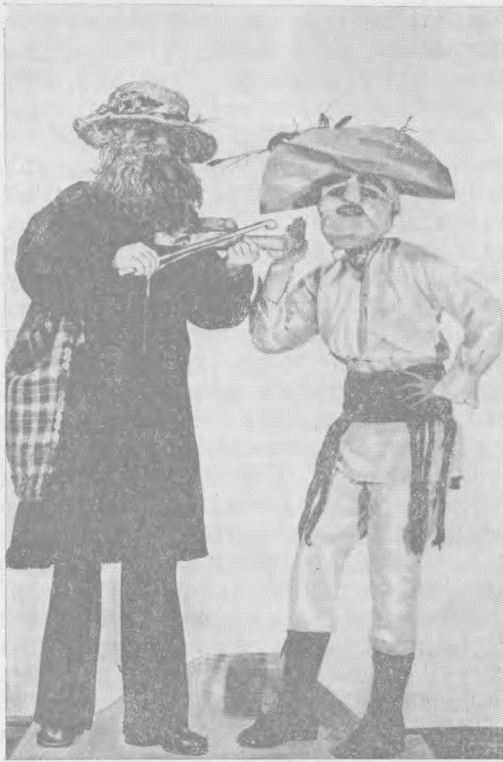
Рис. 8. Старик и жених — персонажи «Нунты», УССР, Черновицкая обл., Глубокский р-н, с. Волока, ГМЭ, № 8424—29, 36