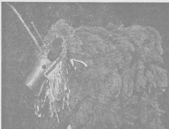
Рис. 2. Коза. МССР, Бричанский р-н, с. Коржеуцы (ГМЭ, № 8424—27)