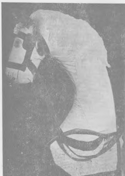
Рис. 1. Конь. МССР, Бричанский р-н, с. Коржеуцы (ГМЭ, № 8424—26 аб)

В развитии культа быка в Молдавии прослеживается несколько этапов. Накануне Нового года по селам в прошлом водили «священное животное», заходили с ним в дом, желая хозяевам благополучия и урожая 11 . Постепенно обряд изменился