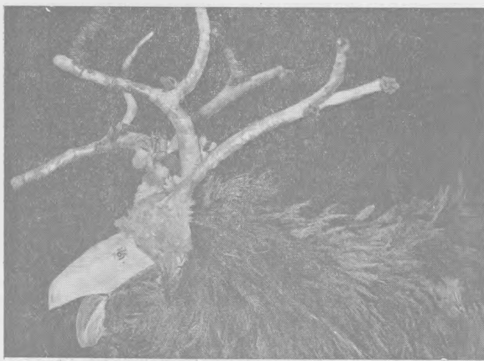
Рис. 3. Олень. УССР, Черновицкая обл., Глубокский р-н, с. Волока (ГМЭ, № 8424—28)

Рассмотренные нами маски зооморфных персонажей новогодних «игрищ» молдаван, имеющиеся в музейном собрании, свидетельствуют не только о сохранении обрядовых новогодних игрищ на этой территории, но и о тех изменениях в мировоззрении молдавского крестьянства, которые произошли за годы Советской власти.