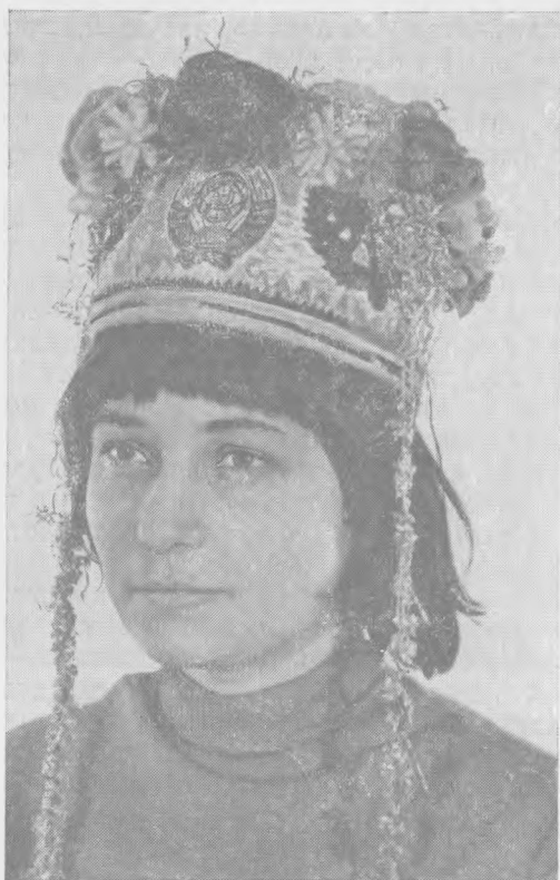
Рис. 4. Головной убор Маланки. МССР, Бричанский р-н, с. Клокушна (ГМЭ, № 7775—14)

значительной эволюции декора головного убора (№ 8424-14). Остальной же костюм главной героини не меняется — это традиционная национальная одежда: искусно вышитая рубаша ( камаше ), домотканая поясная одежда ( катринце ), яркий шерстяной пояс и неизменный, щедро вышитый шелком или бисером кептарь. Возможно, устойчивое использование комплекса костюма в подобных празднествах является в определенной степени стимулом к сохранению народной одежды в Молдавии 27 .