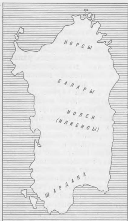
Рис. 2. Схема предполагаемого расселения племен древней Сардинии

В VI в. до н. э. на Сардинии появились карфагеняне. Их поведение на острове носило уже характер военного завоевания. Известно, однако, что приморские города сдались им без сопротивления. Это подсказало многим исследователям вывод, что население Норы, Каралиса и некоторых других приморских городов к моменту вторжения на остров карфагенян уже было финикизировано и миролюбиво встретило родственный ему по языку народ. Но не все население Сардинии так отнеслось к своим завоевателям. От Юстина (XIX, 1) и Диодора Сицилийского (V, 14) известно, например, что сельские жители прибрежных равнин и холмов бежали от карфагенян в горы внутренней части острова. Логично предположить, что среди них был и народ шардана. Итак, представители его оказались частью пунизированы,