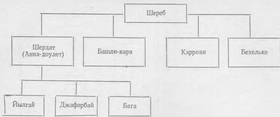
Схема 2. Родоплеменное деление иомутов шерев-джафарбай 1 (по данным Иомудского Карашхан-оглы) *

* На схеме показано деление только тех родовых подразделений, о которых говорится в статье.