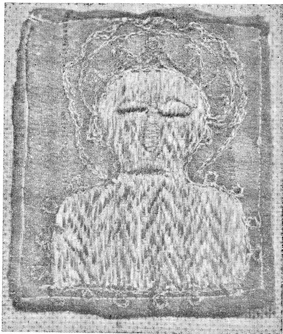
Рис. 2. Поясное изображение человека (вышивка)

трактовано еще более условно: гладевым швом по высокому шаблону обозначены лишь нос, рот и брови. Внутри «нимба» можно усмотреть головной убор. По словам У. И. Савиной, вышивавшая его женщина также страдала головной болью.