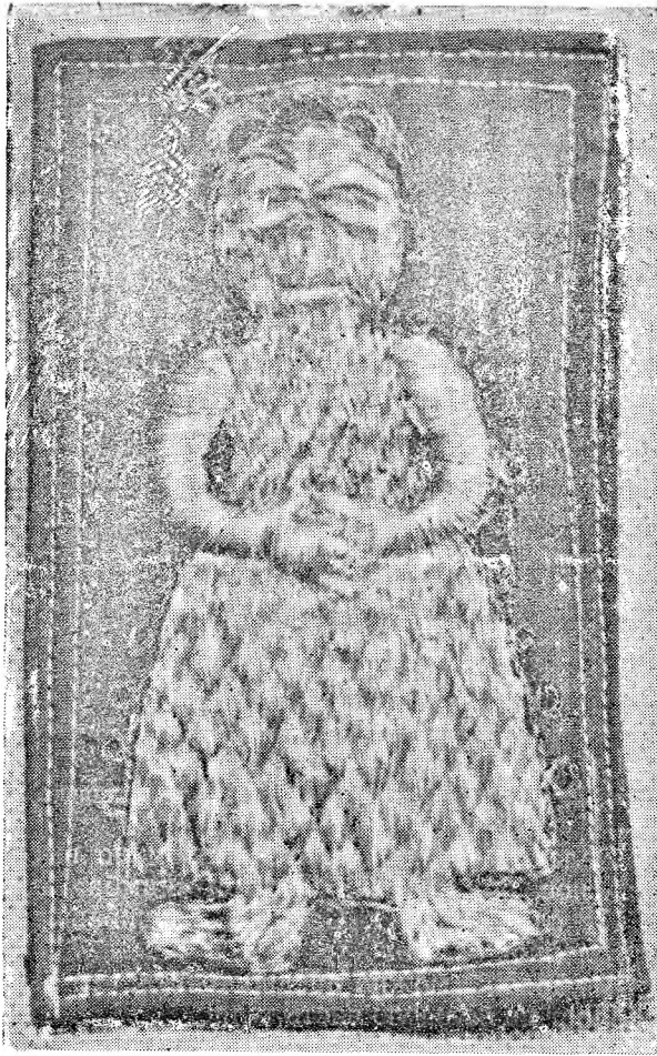
Рис. 1. Фигура женщины (вышивка)

не напоминают рисунок пестрядиной ткани, широко распространенной в старой деревне. Из нее шили женские сарафаны, юбки, фартуки (на Каргополье бытовали косоклинные сарафаны, которые несколько напоминают сарафан на вышитой фигуре).