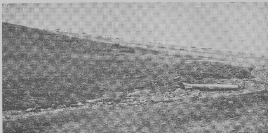
Рис. 1. Место городища зимовья Н. Фомина