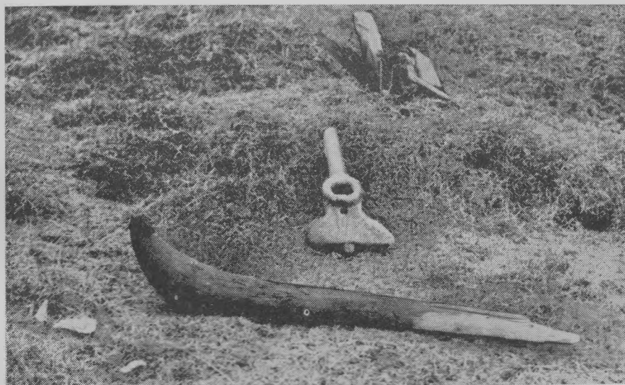
Рис. 2. Детали старинных нарт, найденные на месте зимовья Н. Фомина

ган». В 40-х гг. XVIII в. это была самая дальняя от устья Пясины постройка на севере 4 . Развалины этих поселений сохранились до сих пор.