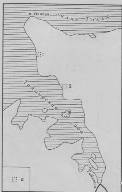
Рис. 3. Местонахождение развалин поселений XVIII в. в р-не Таймырской губы: а — развалины зимовий; 1 — остатки сруба (2,5×6,5 м), впервые обнаруженного в 1915 г. экспедицией Б. А. Вилькицкого; 2 — городище зимовья Н. Фомина, найденное в 1972 г.; 3 — развалины постройки (2,5×3 м), обнаруженной в 1843 г. А. Ф. Миддендорфом

По путевому журналу Х. Лаптева (1741 г.) можно восстановить место нахождения зимовья «новокрещенного якута» Никифора Фомина 9 на Таймырской губе, построенного за 7 лет до посещения этих мест Х. Лаптевым 10 . В журнале содержатся сведения о том, что якут Н. Фомин выехал на промысел на 80 верст к северу от устья реки Таймыры, пере-