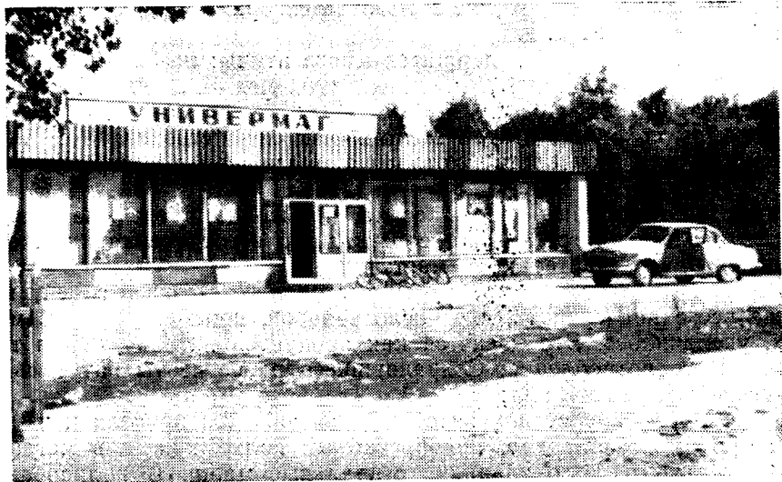
Рис. 1. Универмаг в селе Дархан