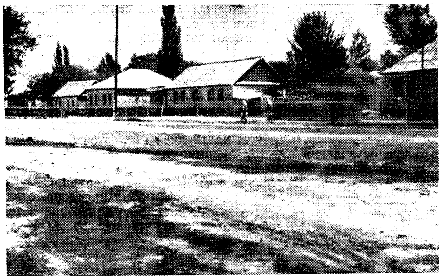
Рис. 2. Улица в селе Дархан

который будет включать швейную и сапожную мастерские, парикмахерскую и фотоателье.