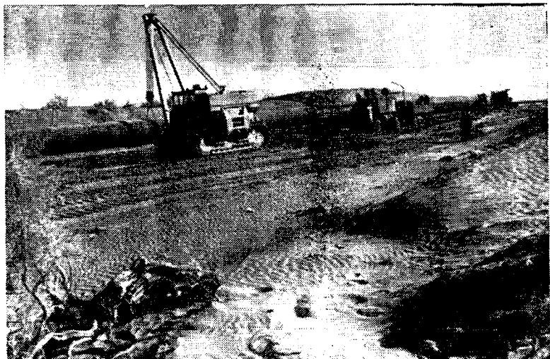
Рис. 3. Строительство газопровода Средняя Азия — Центр.

риев, тем больше их сила как революционного класса, тем ближе и возможнее социализм» 19 .