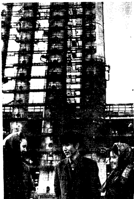
Рис. 1. Один из цехов нефтеперерабатывающего завода в г. Краснодарске

мышленность, увеличился выпуск продукции электротехники, были открыты и сданы в эксплуатацию десятки новых месторождений нефти и природного газа, завершилось сооружение газопровода Майское-Безмеин, а также передача туркменского газа в крупные промышленные города центральных промышленных районов страны.