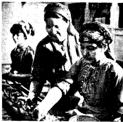
Рис. 5. Работницы ашхабадского шелкомотального комбината за работой

В 1940 г. среднегодовая численность рабочих и служащих в народном хозяйстве республики выросла до 188,3 тыс. чел. 29 Среди них немало было выпускников школ ФЗО и ФЗУ Украинской ССР, Татарской АССР, высших учебных заведений и техникумов Москвы, Баку,