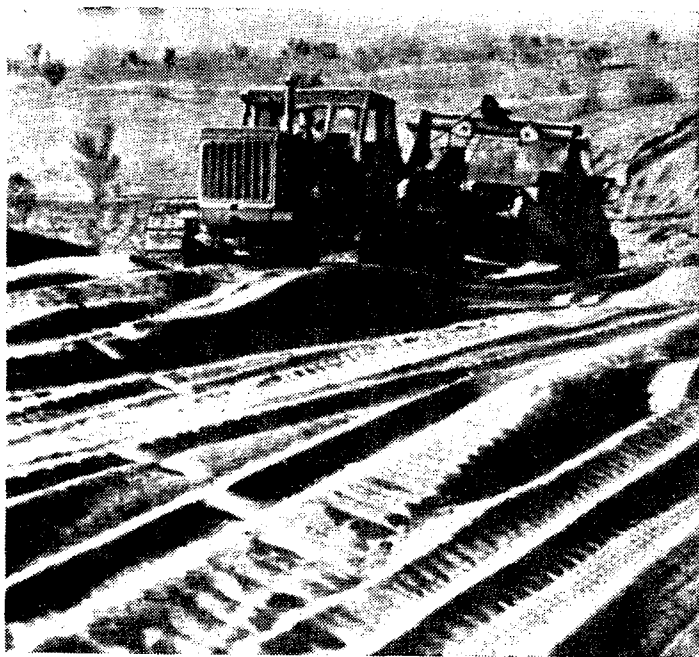
Рис. 4. Каракумы отступают.

и широким привлечением их к участию в социалистическом строительстве. Уже в 1928 г. в глубине Каракумов среди кочевников было создано 38 аульных советов 21 , десятки школ и других культурно-бытовых объектов.