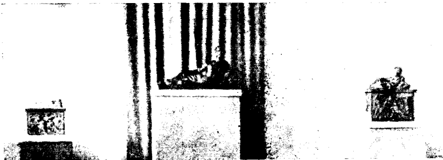
Рис. 1. Этрусская урна-пеплохранилища IV—II вв. до н. э.