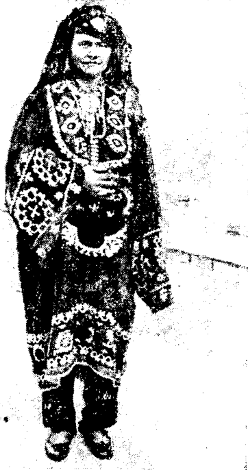
Рис. 5. Костюм женщины из Куляба