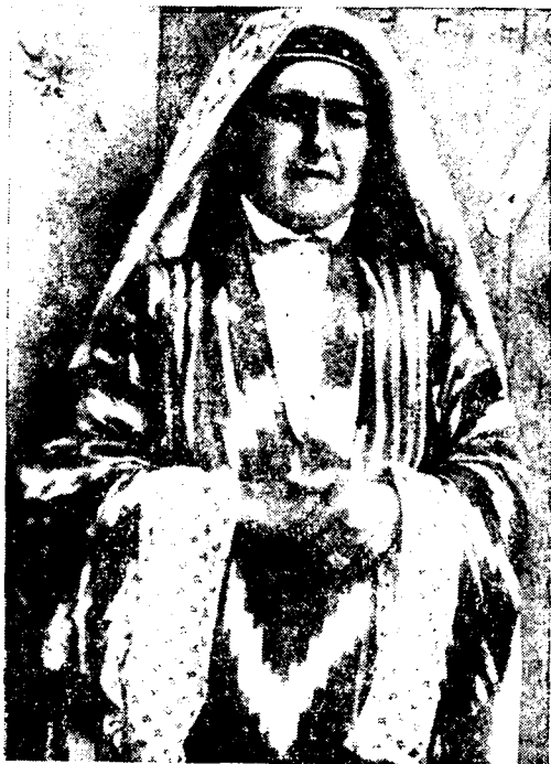
Рис. 6. Костюм женщины из Каратегина

Боковые клинья в большинстве измеренных нами платьев расширились книзу примерно в два раза (10—12 см вверху и 18—27 см внизу), и лишь в одном платье ширина боковых клиньев вверху и внизу была почти одинаковой — 13 и 13,5 см 11 .