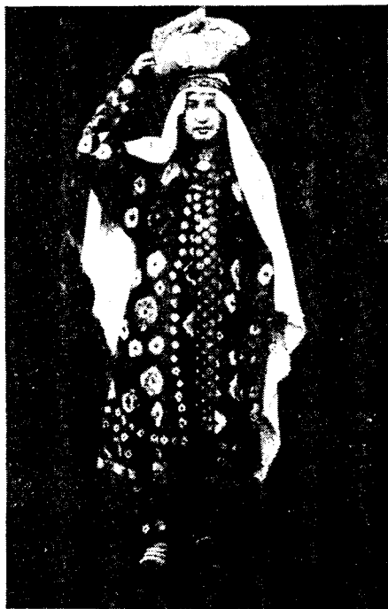
Рис. 3. Женский костюм из нижних кишлаков Дарваза