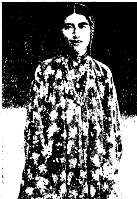
Рис. 7. Платье женщины из Зеравшана (обычно женщины носят головные платки)

Все эти платья сделаны умеренно широкими — 45—50 см, обычно меньше точки фабричной ткани. Рукава длиной в одну полную точку фабричной материи были на четверть длиннее руки (от 60 до 75 см). Ширина рукавов, одинаковая по всей длине, меньше, чем в каратегинских и кулябских платьях позднего времени. Чаще всего она равняется одной четверти, т. е. 20 см с небольшим (рис. 2, 6; рис. 7). По сведениям пожилых женщин, раньше ширина рукавов была еще меньше. Во время нашего обследования в Матче и некоторых боковых долинах верховьев Зерав-