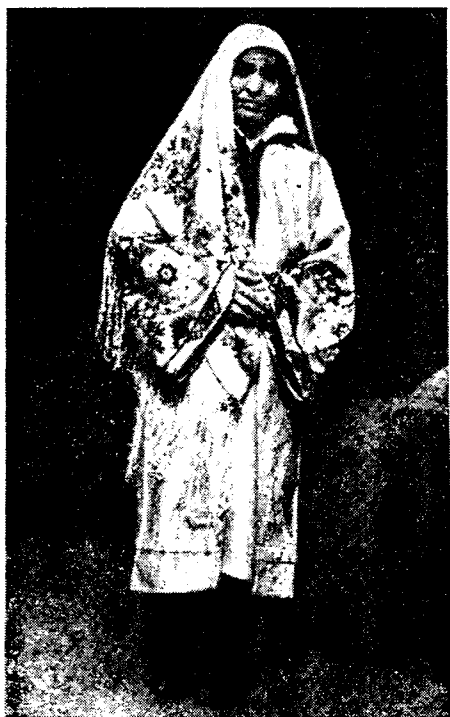
Рис. 4. Костюм женщины из центральных кишлаков Дарваза