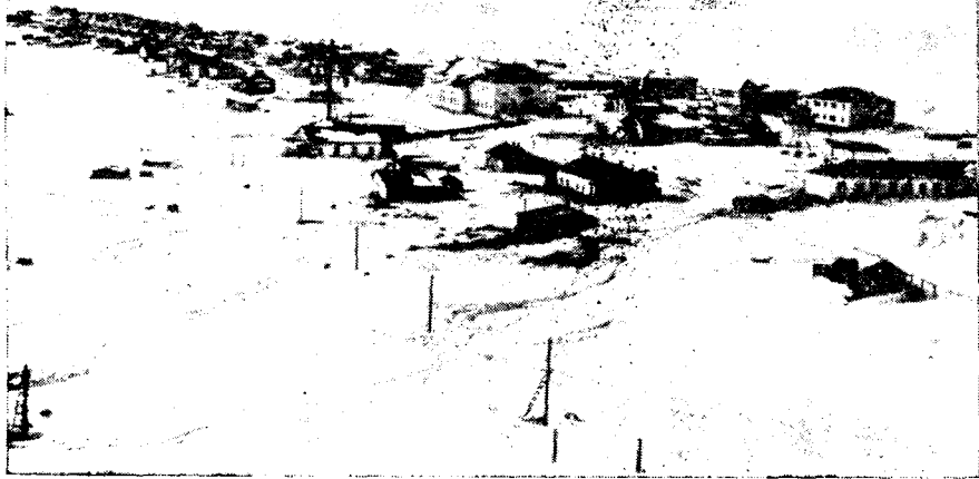
Рис. 3. Поселок Уэлен

Прибрежное хозяйство увязано с оленеводством и с рядом новых для Севера видов сельского хозяйства.