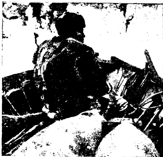
Рис. 1. Охотник на байдарке

шении семьи — чукотско-эскимосские, эскимосско-чукотские, русско-чукотские, чукотско-русские, чукотско-эвенские, чукотско-украинские и др. — составляют в пос. Нешкан 5%, в Энурмино — 4, в Инчоуне — 6, в Уэлене — 11, в Лорино — 11, в Лаврентии (районный центр) — 30, в Сирениках — 16, в Новом Чаплине — 23%.