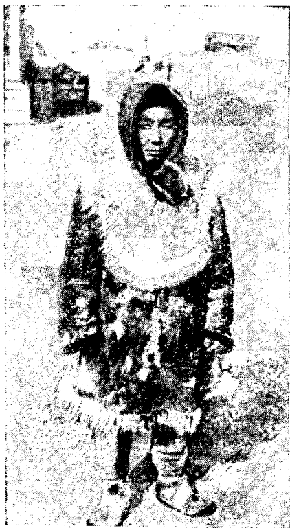
Рис. 4. Охотник, береговой чукча в промысловом костюме

В поселках береговые и оленные чукчи, так же, как и пришлое население, носят современную одежду городского покроя, преимущественно покупную. Молодежь стремится следовать моде. Большим спросом пользуются куртки и пальто из синтетических материалов, вязанные свитера, кофты. В большинстве семей помимо обыденной домашней и рабочей одежды как у взрослых, так и у детей имеется набор праздничной одежды — костюмы, платья, платки, блузки, рубашки. Летом на промысле широко используют не только брезентовые плащи, утепленные штормовки, резиновые сапоги, но и камлейки, и брюки традиционного покроя, только сшитые из клеенки. Легкие и удобные камлейки из моржовых кишок теперь почти не используются, так как изготовление их требует значительных затрат времени и сил. Охотники-зверобой и оленеводы высоко ценят непромокаемые летние сапоги из нерпичьей кожи с лахтачьими подошвами. Национальная чукотско-эскимосская меховая одежда и обувь в наши дни находит широкое применение в качестве зимнего промыслового костюма (рис. 4). Но нередко во время долгих скитаний по морю на вельботах охотники и летом надевают меховые кухлянки и брюки.