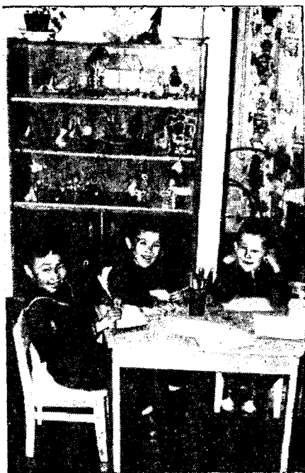
Рис. 5. В Уэленском детском саду

Чтобы избежать разобщенности поколений, принимаются специальные меры: в детских садах введены часы чукотского, а там, где преобладают эскимосы, эскимосского языка; чукотский и эскимосский языки