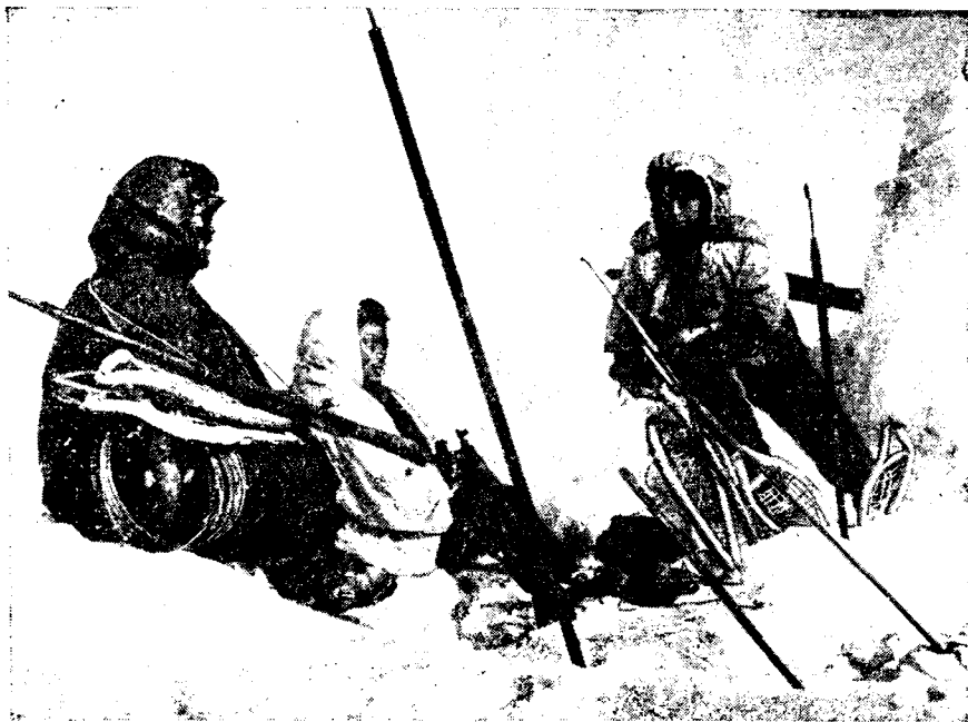
Рис. 2. Группа уэленских охотников на нерп

изготовлена новая байдара. Остов ее, скрепленный лахтачьими ремнями, имеет 10 м в длину. Покрышка для этой лодки была сшита женщиной из четырех шкур двухлетних моржей. Обтягивали лодку мужчины. Срок службы такой обшивки обычно не превышает двух лет. Отдельные охотники для своих личных нужд изготавливают небольшие каркасные лодки до 4 м длиной, обшитые моржовыми шкурами. На них также устанавливают мотор. Малые байдары применяются для поездок на охоту, используются зимой для того, чтобы перебираться через разводья во время охоты на ледяном припае и т. д. (см. рис. 1).