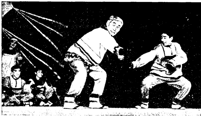
Рис. 6. Национальный чукотско-эскимосский ансамбль «Эргырон» («Рассвет»)

мужское имя, например Кайнын — медведь, характерное для мужчины, не подходит к женщине, так же как Нутенаут — «полевая женщина» — к мужчине (если глава семьи женщина). В связи с этим во многих семьях и в настоящее время у каждого члена семьи сохраняется своя фамилия (она же личное чукотское имя).