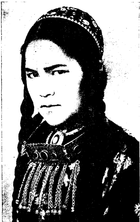
Рис. 2 Девушка с нагрудным украшением — буков (с. Искандер Казанджикского района)

вичьи украшения появлялись у девочек лет с пятишести. Обычно вся тюбетейка зашивалась серебряными монетами, а сверху укреплялся серебряный куполок с навершием и серебряными подвесками ( гунба ). У текинцев и других южных туркмен (кроме иомутов) с боков тюбетейки по вискам девочки спускались серебряные ( чекелик ) (см. рисунок на обложке) или бисерные ( хунжи, алага ) подвески; на концах последних были укреплены кисти из черного шелка ( гара готоз ). На тюбетейках туркмен восточных и северных районов кисти держались не на бисерных, а на шелковых черных шнурочках. Тюбетейки семилетних девочек из богатых текинских семей украшала спереди не только купба, но и серебряная диадема ( сумсуле ), обычно же это украшение укреплялось на тюбетейку девушке-невесте.