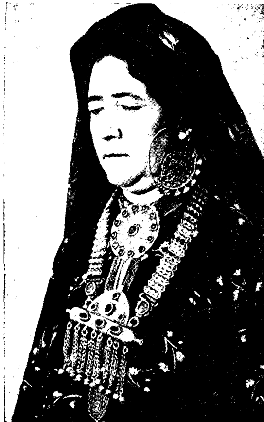
Рис. 1. Женщина-номутка с традиционными украшениями — гульяка, гулакхалка и ачарбаг (с. Ис-кандер Казанджикского района)

В первую входят различные украшения на женский и девичий головные уборы, налобные и височные украшения, ушные и носовые серьги.