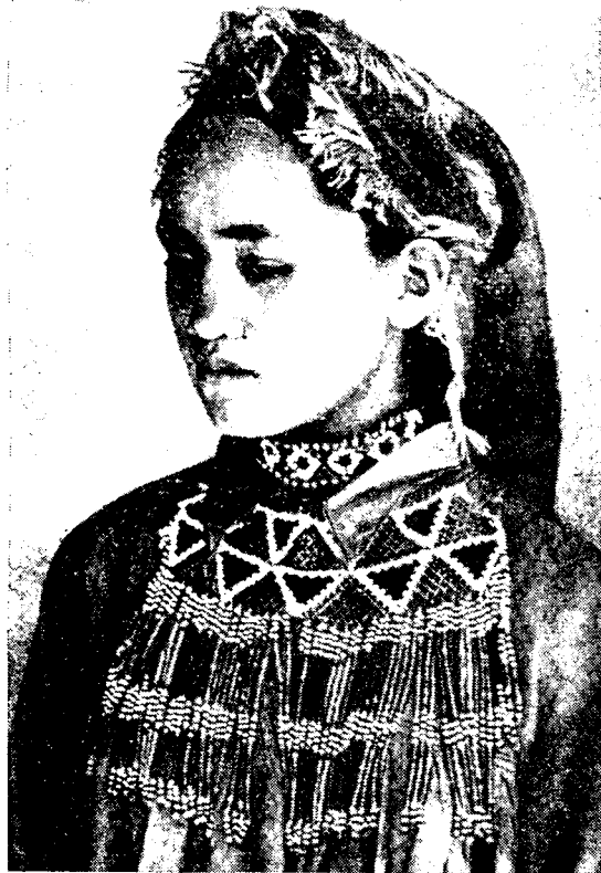
Рис. 3 Девушка с бисерными нагрудными украшениями — нарванча и хапаванд (колхоз им. Ленина Чарджоуского района)

ажурная пластина с подвесками на концах, спускаясь на грудь; на спине на уровне плеч носили украшение в форме удлинённого треугольника с подвесками ( енселик ), игравшее роль оберега. Это украшение, характерное лишь для туркмен-текинцев, сарыков и отчасти иомутов (во всяком случае наши информаторы из других групп туркмен о нем не знают), перестали носить, вероятно, с начала XX в. (хотя в семейных «сундуках» оно встречается не так уж редко), и информаторы, даже преклонного возраста, путаются в определении способа его ношения. Одни считают, что енселик укрепляли на тубетейке, другие — что его носили на пестрой тесьме на шее.