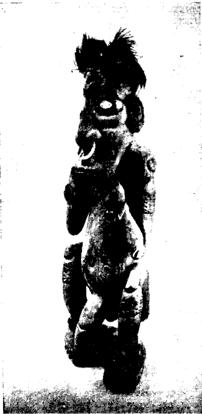
Рис. 1. Фигура предка (Новая Гвинея. р. Селик)

нганасан, долган, энцев, а также народов народов зарубежных стран (всего свыше 800 предметов).