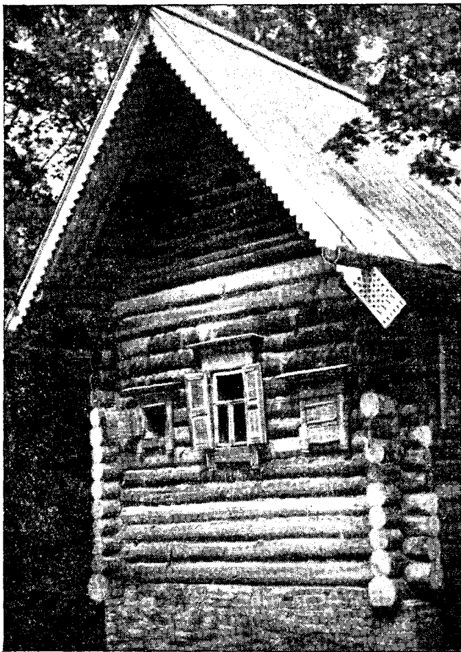
Рис. 3. Изба из дер. Кошелево Ковернинского района (начало XX в.)

«соломой по «спишникам» и «суковедам». Застройка деревень отличалась высокой плотностью, малыми расстояниями между избами и хозяйственными дворами, гнездовым расположением бань и амбаров. На улицах и в усадьбах не было зелени. В изгородях преобладали прясла, встречался и «заплот».