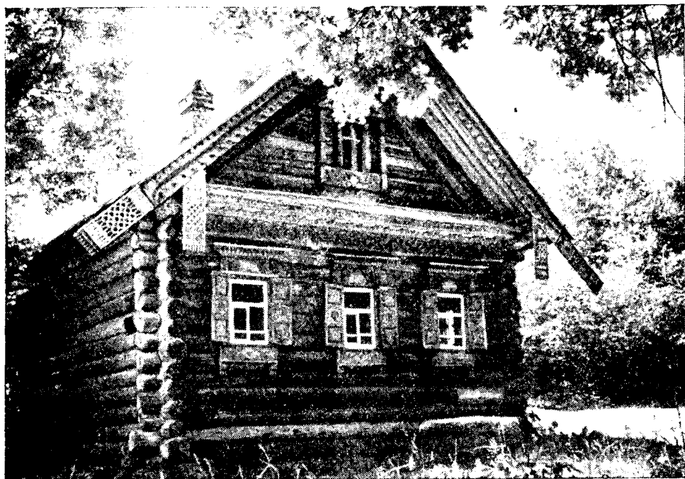
Рис. 4. Изба из дер. Ульянково Городецкого района (середина XIX в.)

с повалами, верхней овин и открытое гумно с мякинницей. В архитектурно-декоративном решении жилища широко использовались в течение всего XIX в. глухая резьба, главным образом растительного характера, с изображениями львов, фараонов, сирингов и других сказочных существ. В процессе эволюции жилища конструкция и композиция его последовательно менялись: от самцовых щипцов с повалами, подкрылками, волоковых окон к самцам из пластин с «лобовой» доской, двум волоковым и одному красному окнам и, наконец, дощатому фронтому с подшивным карнизом, трехчастному большому слуховому окну, украшенному резьбой карнизу с фризовой резной доской, пышным наличником с резным очельем и филиченатыми ставнями. В композиции жилища существенную роль играли парадные въездные ворота: верейные столбы с плетенкой и розетками, воротные и калиточные арки со львами и цветами. Резьба часто раскрашивалась красками, иногда применялась роспись на фронтоне в виде львов, вазонов с цветами и пр. В конструкции крыши с середины XIX в. широко применялся тес по стропилам. Значительная часть деревень в подзоне располагалась по речкам и оврагам и состояла из небольшого количества домов, поставленных близко один к другому. Своеобразны были в этом районе колодцы со ступальным колесом, а также промысловые постройки: работни, стирни для валяльного промысла и водяные токарни для посудного.