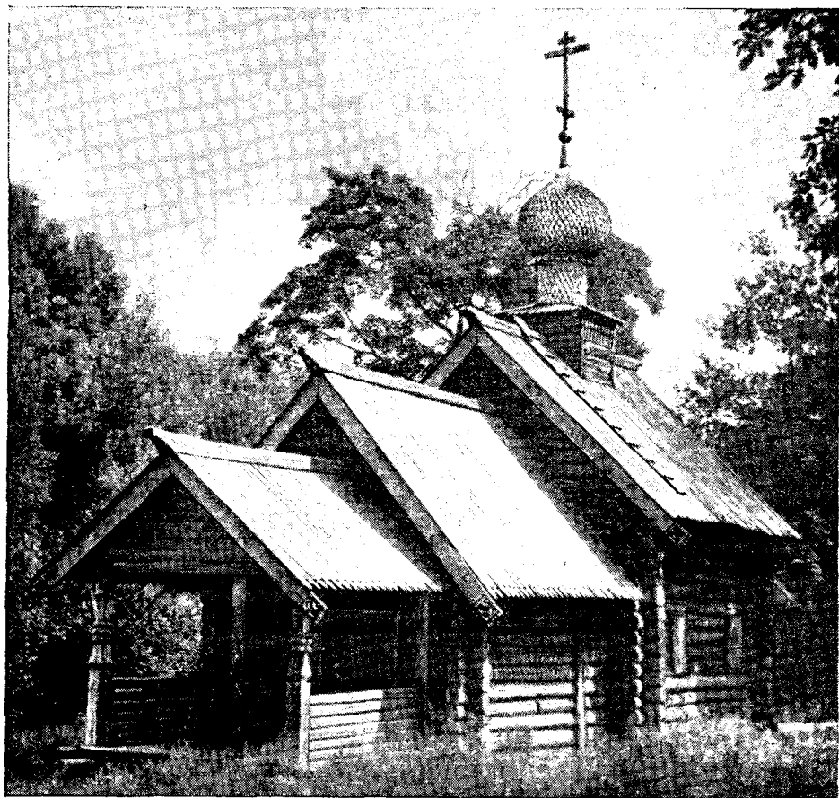
Рис. 6. Клетская церковь из села Зеленово Городецкого района (1720 г.)

вертикальными гнетами. В усадьбе на огороде строили погреб с «напогребницей», баню, открытое гумно с ямным овином. Кладовые, рубленные из тонкого леса, стояли перед избой. Иногда кладовой служили полуземлянки, так называемые «выходы».