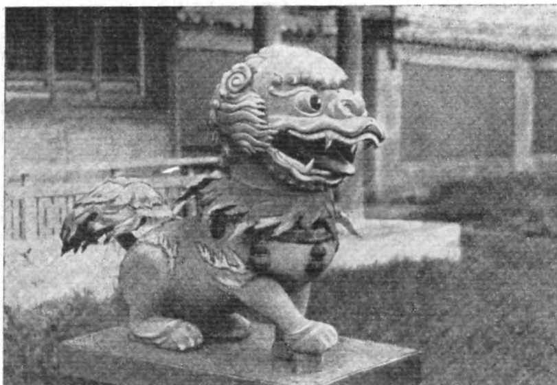
Рис. 6. Улан-Батор. Деталь музейного комплекса «Дворец Богдо-Гэгэна». Лев — «собака Будды», охраняющий вход в храм

все сферы бытия. Вместо 747 монастырей (данные на 1921 г.) в стране действует один, а монахов сейчас не 100 000, а немногим более 100. Единственный действующий монастырь Гандантекчинлинг находится в Улан-Баторе, является центром жизни буддистов Монголии и, в соответствии с духом времени, туристическим объектом. В дни больших хуралов он собирает немало верующих, а по воскресеньям служит местом паломничества туристов и просто жителей столицы, многие из которых приходят в монастырь как в клуб или парк, так что кажущееся на первый взгляд оживление в храме отнюдь не является признаком возрождения религии. Это неоднократно отмечали иностранные путешественники и ученые, побывавшие в МНР 20 . Гандантекчинлинг и его оживленная деятельность, политическая, экономическая, научная,— это реликты былого могущества официального ламаизма.