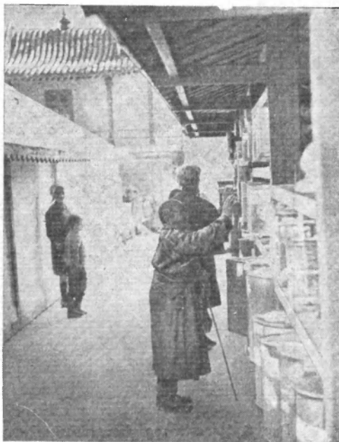
Рис. 5. Улан-Батор. Монастырь Гандантекинлинг. Покрутить молитвенные барабаны — долг каждого верующего и каждого туриста

Интересен еще один канал влияний на монгольскую культуру — индо-тибетский. Это влияние пришло с ламаизмом, пропитало собой духовную жизнь монгольского общества и сейчас еще достаточно ощутимо. Организационная структура ламаистской религии, жизненный уклад сангхи (буддийской общины), каноническая литература пришли в Монголию в более или менее сложившемся виде и после некоторой адаптации были усвоены обществом и сохранялись более 200 лет. В то же время сугубо светские стороны жизни, не имеющие к религии прямого отношения, оказались ламаизированными и в таком виде существуют и сейчас. Таков, например, монгольский именной календарь, в котором личные имена тибетского и санскритского происхождения составляют значительную часть. Таковы наименования дней недели, существующие в санскритском и тибетском монголизированных вариантах.