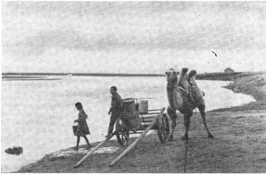
Рис. 3. Так ездят за водой жители долины Керулена

Но те семьи, чьи дети пойдут 1 сентября в школу, должны спешить — этим на помощь направлены все грузовики.