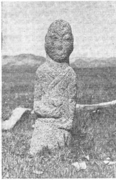
Рис. 1. Каменная баба с территории Хапгай-сомона Арахангайского аймака МНР