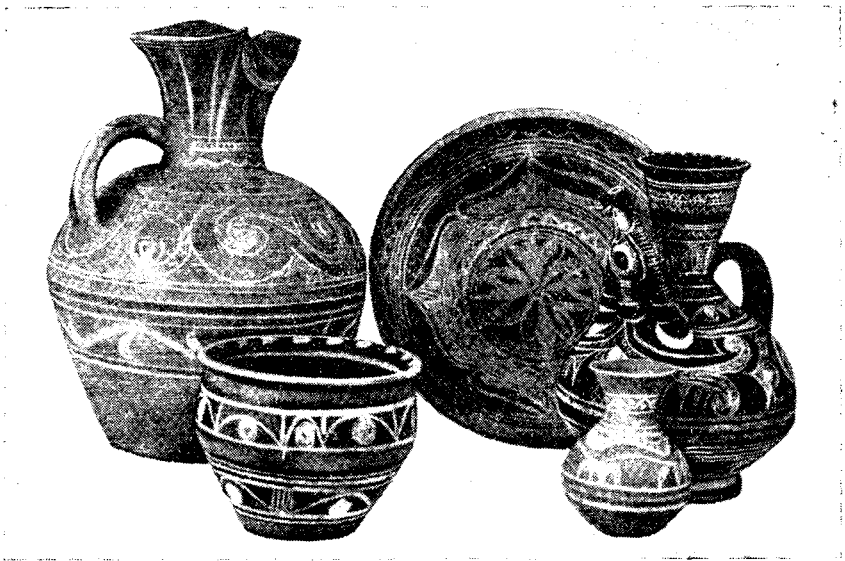
Рис. 3. Современные гончарные изделия селения Балхар, Дагестанская

основе традиций древнерусской живописи родилась и получила интересное развитие миниатюрная живопись Палеха, Мстеры, Холуя 8 . Традиции русских живописных эмалей продолжают мастера фабрики «Ростовская финифть».