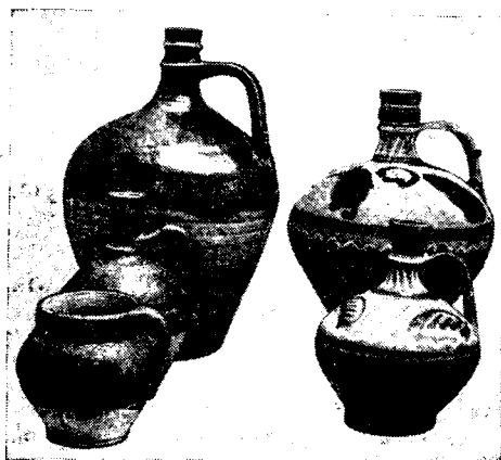
Рис. 8. Современные гончарные изделия мастеров Унгенского р-на Молдавской ССР, 1971 г.