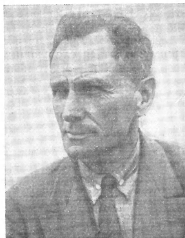
Рис. 1. Владимир Клавдиевич Арсеньев. Фотография В. Н. Пашковского, 1929 г. Публикуется впервые (Из архива А. Н. и К. А. Криштофовичей)

В течение нескольких лет В. К. Арсеньев работал в районах, заселенных главным образом удэгейцами и орочами. В 1902—1903 гг. он обследовал южные районы Уссурийского края от р. Сучан до р. Лефу. После окончания русско-японской войны 1904—1905 гг. Арсеньев сосредоточивает свое внимание на более северных районах края — вблизи хребта Сихотэ-Алинь. Он совершает ряд походов от Уссури через перевалы до побережья Японского моря. За это время он убедился в том, что этнографические исследования С. Н. Брайловского по удэгейцам и В. П. Маргаритова по орочам недостаточно полны и решил серьезно заняться изучением этих народов. Он обратился за помощью в петербургский Музей антропологии и этнографии им. Петра Великого. Ему ответил Л. Я. Штернберг, между ними завязалась переписка. Штернберг не только дал Арсеньеву методические советы, но и прислал ему ценные книги, в том числе труды Л. И. Шренка и Р. К. Маака. Штернберг инту-