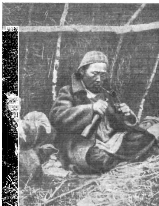
Рис. 3. Дерсу Узала

In September 1972 we celebrate the hundredth birth anniversary of the prominent writer and explorer of the Russian Far East, V. K. Arsenyev. The article recounts his ethnographic field work, learned publications, museum work, his literary works devoted to the region's aborigines.